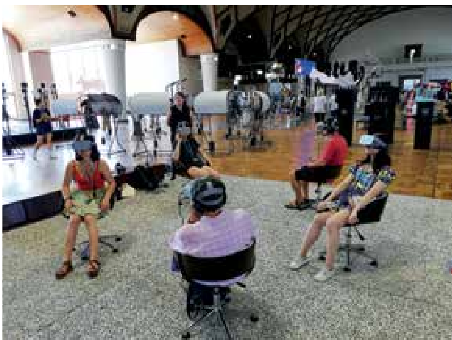
▶ Design and Destroy című kiállítás – a látogatókon a VR-szemüveg (Írország – Országok és régiók)