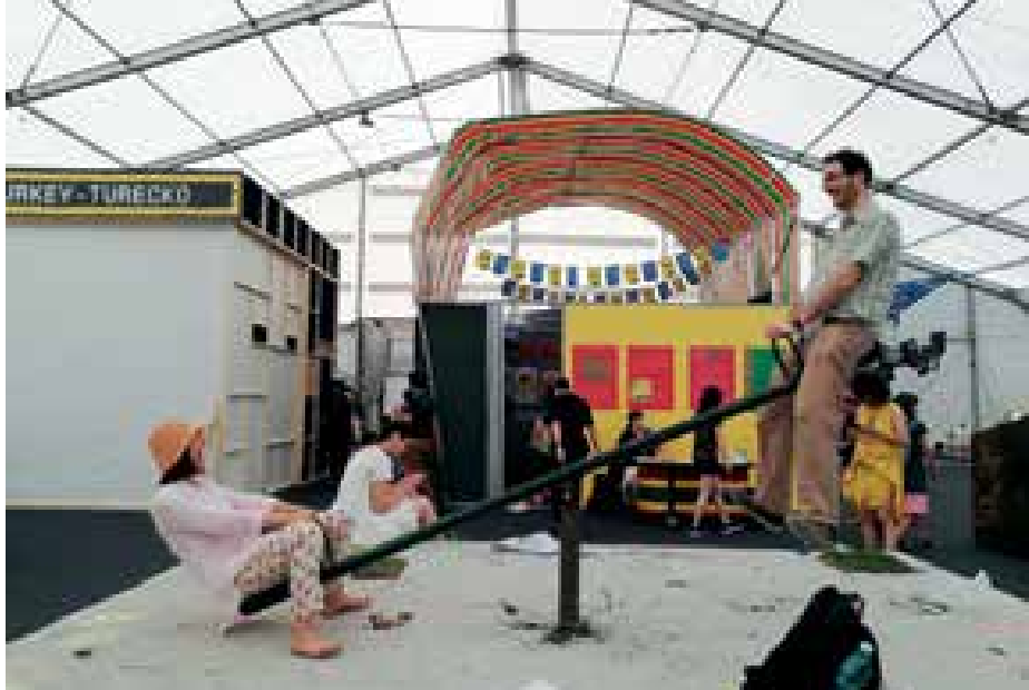
► Az egyik szerb kiállító és jómagam a libikókán – Szerbia – Diák szekció, háttérben Tajvan – Az öltöző című kiállítása. A kép jól mutatja azt a közvetlenséget, amellyel az ember itt-ott találkozhat ezen az eseményen

A fülke falain láthatók voltak még különböző fotók, cetlik, plakátok, amelyek a látogató által „alakított” szerep megismerésében kulcsot jelenthettek. Valamint minden fülkében el volt helyezve egy ábra a szereplők közti relációkról. Mikor mindenki elkészült, elindult a „darab” – ami egyébként egy kortárs szövegvény alapján készült. A fejhallgatón hallottuk a figuránk belső monológját, és instrukciókat arra vonatkozóan, hogy most mit tegyünk. Így állt össze a „játék”, és így hozta össze ez az élmény a különböző országokból idelátogatókat egy közös partira egy kis „tajvani” bárban. Szintén díjat nyert ez a munka, méltán. Ehhez is őszintén gratulálok!