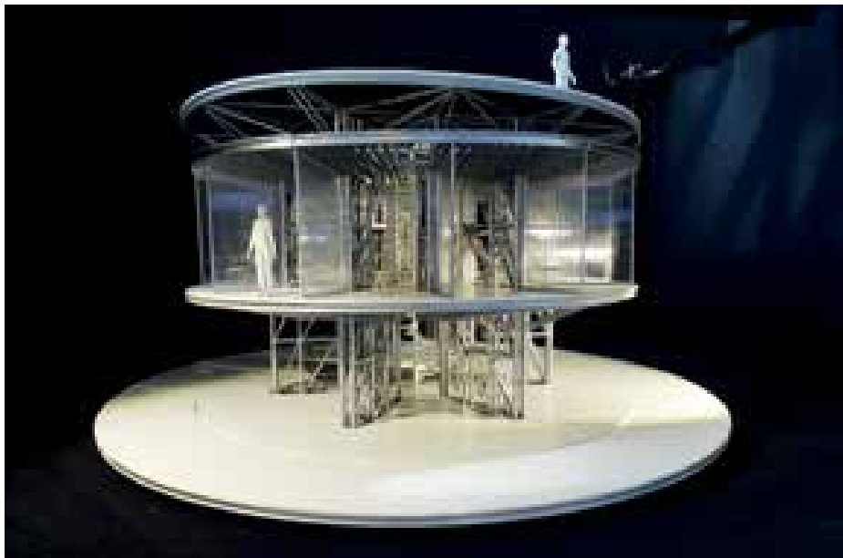
► Az Országok és régiók szekciójában az Egyesült Királyság kiállításának egyik makettje

Elsőként Tajvan kiállítása fogott meg az Országok és régiók szekciójában, több okból is. Egyrészt ez volt az első helyszín, amit az első megérkezést követő fölcsupás után tüzetesebben végignéztem. Odáig az ember csak akklimatizálódik, gondolkodik, mit is kellene megnézni elsőként a több száz négyzetméte-