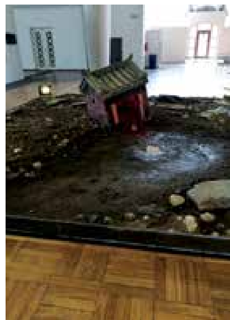
► A süllyedő világ (Tajvan – Országok és régiók szekció)

Szeretnék kiemelni még egy-két installációt, melyek valóban maradandó élményt jelentettek. Majdnem mindegyik esetben igaz az, hogy aktív részvételt, a komfortzóna áttörését igényelték a befogadótól. Az egyik ilyen a Diák szekcióban Olaszország díjnyertes munkája volt. A koncepció szerint a látogató bekerült egy nagy fehér dobozba, ami egy kísérleti laboratóriumra emlékeztetett. Az itt közreműködő alkotók némelyike fehér köpenyt viselt, mintha kutatók lennének. Ebbe a dobozba először ablakokon keresztül, mint külső szemlélő tekinthettünk be, és meg kellett próbálnunk elképzelni és leírni vagy leraj-