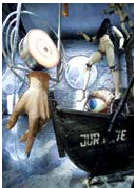
► Részlet Románia installációjából – Országok és régiók szekció

Nagy hatással volt rám Hongkong bemutatója is. Maga az elrendezés azért volt érdekes, mert nagyon sok tervező individuális munkája volt jelen, egyfajta tárlatot hozva létre, mégsem száraz „tétéles felsorolás” lett, annak köszönhetően, hogy az egészet egy remek koncepcióban ötvözték. Minden egyes makett vagy egyéb alkotás egy rácsos dobozba került, ezeket egymáshoz rögzítették. Így az egészet szemlélve olyan hatást keltett, mintha egy konténerszál-