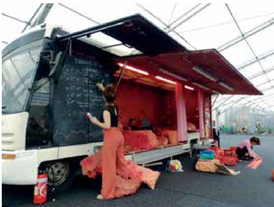
► Kiállítási busz: az önhordó kiállítás egyben közösségi tér (Franciaország – Diák szekció)

mögé bújtatott, deszkákkal és falakkal határolt színház bástyái mögé, ahová csak kivételes alkalmakkor és ünnepélyes keretek között, kiöltözve, nyakkendőben látogat el a „mélyen tisztelt publikum”.