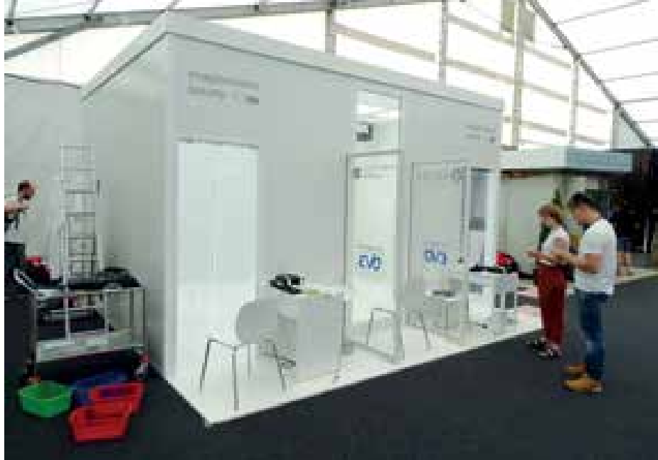
► A „kísérleti laboratórium” (Olaszország – Diák szekció)