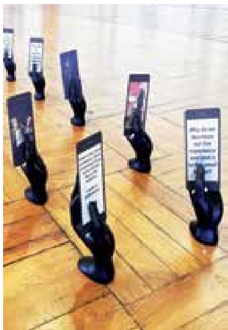
► A libanoni kiállítás elfért egy bőröndben

A másik személyes kedvencem szintén Tajvan, ezúttal a diákok versenyében. (Úgy látszik, Tajvant sikerült mélyen a szívembe zárnom.) Az Öltöző (The Changing Room) című kiállításuk igazi experimentális élmény. Keresem erre a megfelelő magyar kifejezést, de nem találok. Nagy vonalakban a következőképpen írható le: egy otthonosan berendezett tajvani bár, közepén egy kb. 6-8 személyes, kör alakú asztal, tele italokkal, összegyűrt sörösdobozokkal, kiürült poharakkal, körülötte székek stb. Hűtőszekrény, bárpult, a falakon plakátok és mindenféle dolog, ami még egy pubban előfordul. Van azonban 6 kis öltözőfülke is, a 6 szereplőnek. Hogy részt vehessünk ebben a performanszban, idejében fel kellett iratkozni akár napokkal korábban, mert igen népszerű volt ez az időközönként ismétlődő esemény. A hat szerep közül választani kellett egyet. A választásban csak annyi segített, hogy mindegyik figurától egy-egy mondat volt olvasható egy erre a célra kirakott kártyácskán. Mikor választottunk, többé nem volt visszaút. Mehettünk az öltözőfülkébe, ahol egy okostelefonnal összekötött headset és egy jelmez várt.