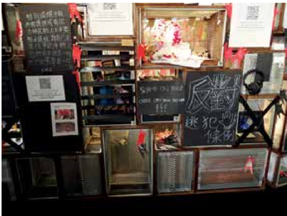
► Hongkong – Országok és régiók – miután a tiltakozó művészek kihelyezték protestálásuk jelképeit

ren. Sokat segített ebben, hogy az egyik kedves tajvani közreműködő megszólított, megtekintésre invitált. Ez máris rámutat arra, hogy a scenográfia valójában mennyire átszövi a mindennapjainkat, még akkor is, ha nem tudatosítjuk magunkban. Nemcsak a színházban vagy más előadóművészetekben dolgozókat, hanem mindenkiét. Gyakori ugyanis, hogy ha megkér-