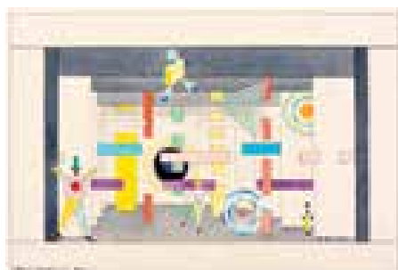
► Mechanikus színpad