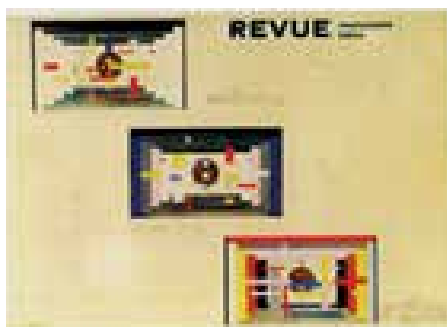
► Absztrakt revü

Egy év pécsi jogtanulmány után, 1918–1919-ben barátját, Molnár Farkast követve Weininger a budapesti Műegyetemen építészmérnöki tanulmányokba kezdett. 1920–1921-ben Pécsen dolgozott, közben rajzolni tanult, és bekapcsolódott a