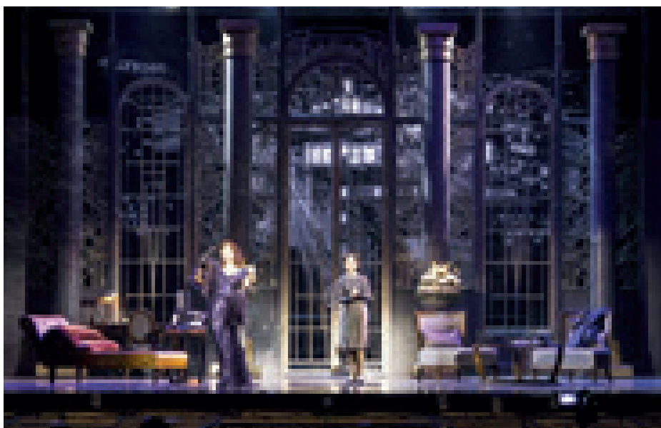
► Hollywood Diva 2014. Szentpétervár. Díszlettervező: Kentaur

frissítjük a díszletet. Ha egy produkció végleg lekerül a műsorról, és a színház kéri, akkor a díszletet visszaszállítjuk a telephelyünkre. Amit ezekből a díszletelemből fel tudunk használni, azt az adott színház következő díszleteibe hasznosítjuk. Amit pedig nem lehet már hasznosítani – egyes elemek veszélyes hulladéknak számíthatnak –, megfelelő telepre elszállítatjuk, illetve a fémhulladékot értékesítjük. Ez általában veszteséges tevékenység, viszont a jó együttműködés a színházakkal fontosabb a veszteségnél.