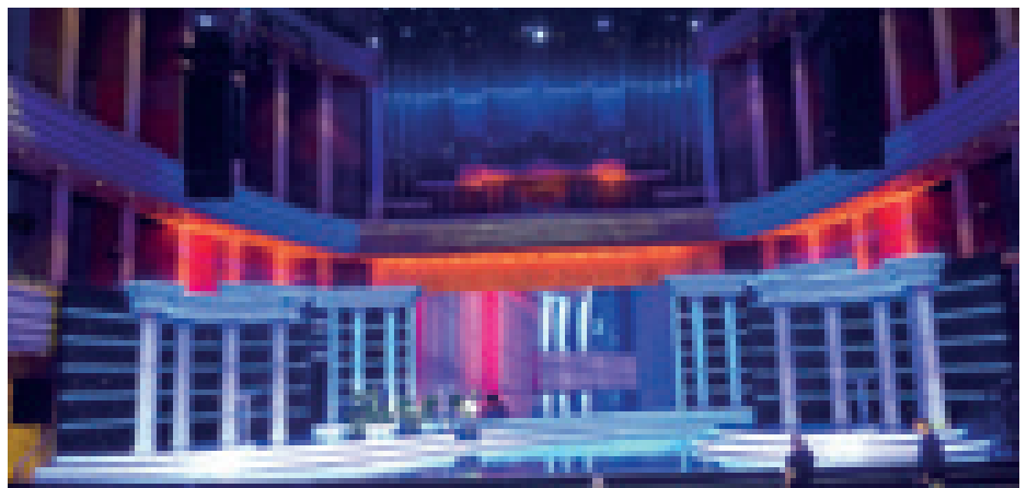
► Prima Primissima 2011. Docler MŰPA. Díslettervező: Kentaur

Az elmúlt évek során elkészített díszletek száma megközelíti a négyszázat. Nagyon sok díslettervezővel működünk együtt sikeresen. Idősebb vagy fiatal, különböző stílusú tervezőkkel, fantasztikus emberekkel, és mindenkitől tanultam egy kicsit. Úgy alakult, hogy eleinte kisebb, később pedig egyre nagyobb dolgok tervezésére is felkértek. Menet közben tanultam bele a tervezői és a szcenikusi szakmába, így ma már olyan munkákat is elvállalunk, ahol a díszletek szcenírozása is a feladatunk.