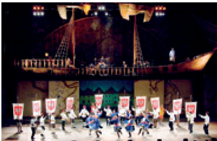
► Benyovszky 2008. Szegedi Szabadtéri Játékok. Díslettervező: Tóth Kázmér

A díszletkészítéssel párhuzamosan készítünk a színpadképekbe egyedi bútorokat is. A díszlettervekben sokszor olyan korabeli bútorok szerepelnek, amelyeket már nem lehet beszerezni, illetőleg nem kaphatók a kereskedelemben. Ilyenkor nekünk kell legyártani az egyedi darabokat. Ehhez a tevékenységhez jó szakemberekre van szükségünk. Eleinte, amikor csak faszerkezeteket gyártottunk, ez a munka nem okozott nehézséget számomra. Ahogy haladtunk a komplett díszletgyártás felé, nekem is folyamatosan tanulnom kellett, bővíteni a tudásomat más anyagok vonatkozásában is. Elkezdtünk gyártani acél- és alumíniumszerkezeteket, ehhez megfelelő szaktudást és szakembereket kellett szereznem. Az ezekhez kapcsolódó elektromos és vezérléstechnikai munkákra is fel kellett készítenünk a cégünket. Így haladtunk a korral, ezért folyamatosan növeltük a létszámot, és vásároltunk egyre újabb gyártóberendezéseket. Így jutottunk el odáig, hogy egy-egy előadás díszletének minden részét – tehát nem csak a faipari részeket – el tudjuk készíteni. Ma már színpadi berendezéseket is képesek va-