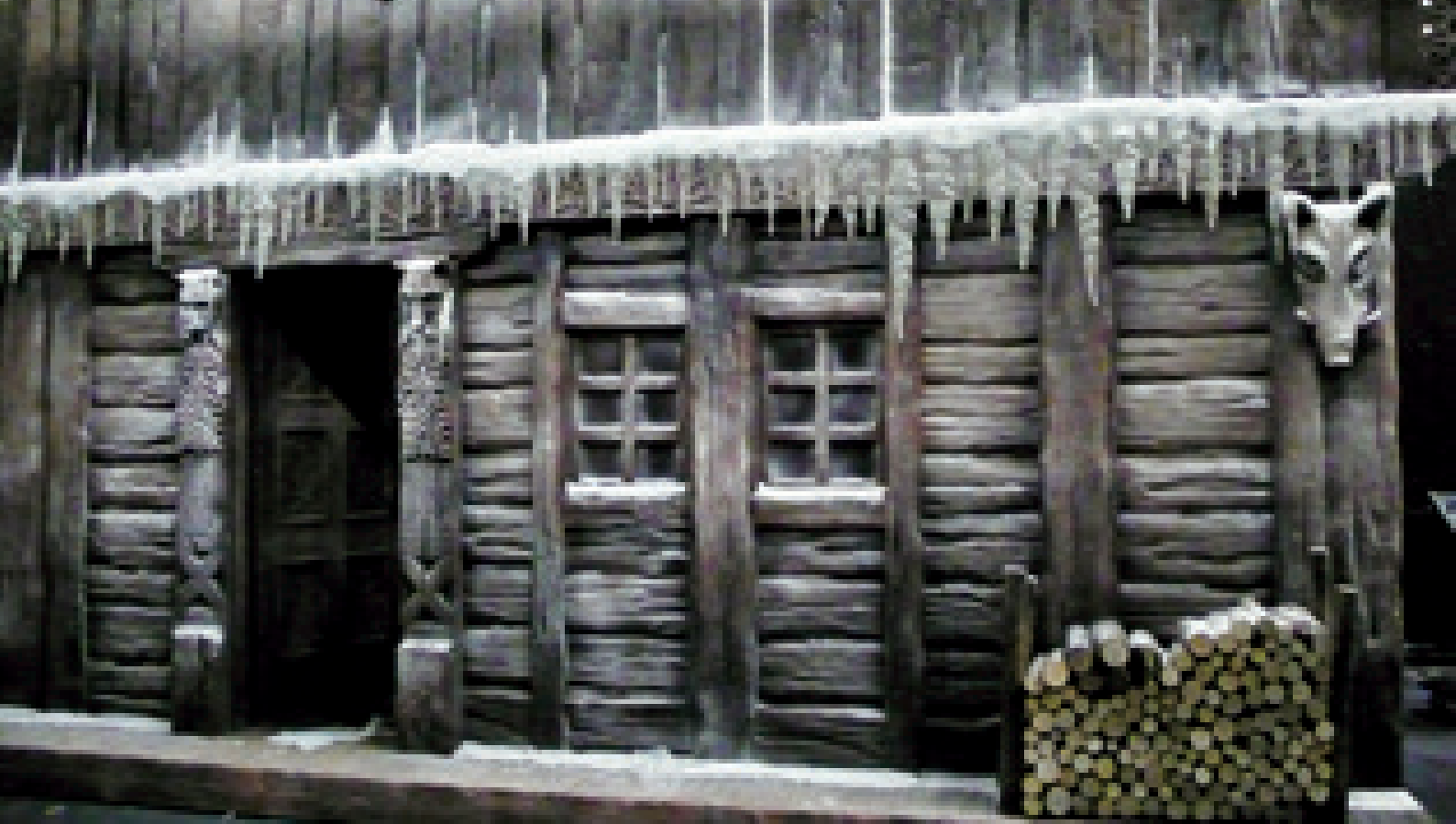
► Vámpírok Bálja 2009. Bécs, 2010. Szentpétervár. Díslettervező: Kentaur

gyunk gyártani, például forgószínpadot, vagy bármilyen mozgásra képes szerkezetet. Egy-egy komplett díszlet kivitelezéséhez nem foglalkoztatunk alvállalkozókat.