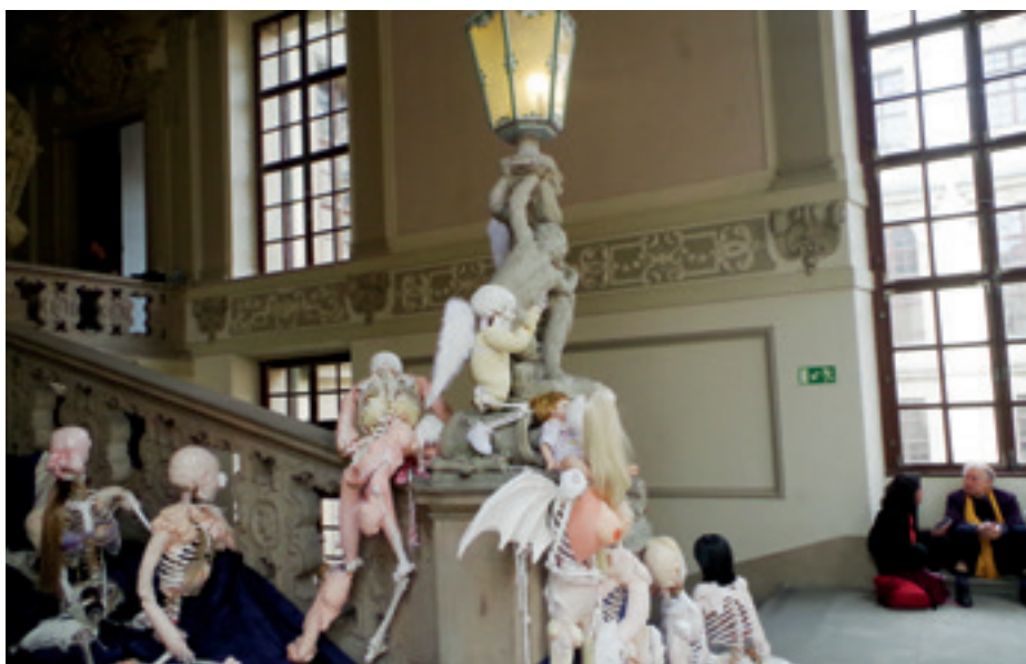
► Norvég horrorinstalláció a Clam-Gallas palotában