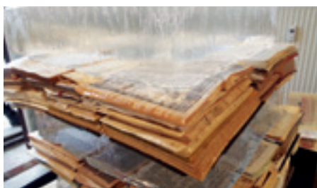
► Szlovák diákok könyve jégábla alatt

Jól látható, hogy a társadalmi felelősséget érző, felvállaló színház egyre erőteljesebben kerül elő a PQ-n. Ezek sorában letisztultságával katartikus volt a lengyel installáció: az apokaliptikus vízió fehér terében rozsdás vasrudak által felnyársalt farönkök magasodtak – egy civilizáció nélküli halott világ kiüresedett tere nagy erejű művészi figyelmeztetés volt... „Pofonegyszerűségével” pedig a legrappánsabb a dánok akciója: sminkszobájukban az arra vállalkozókat egy általuk választott másfajta etnikum képviselőjévé maszkírozták át, de volt, aki nemet vál-