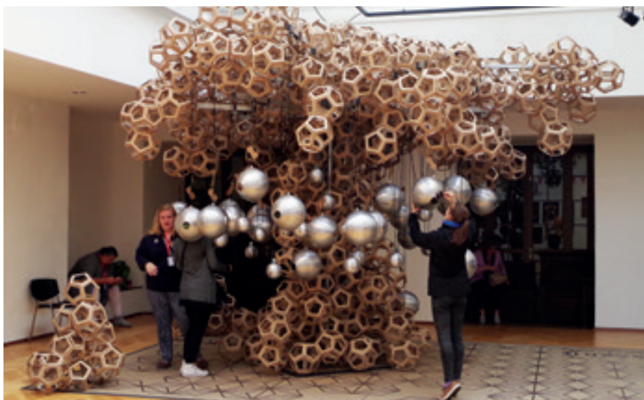
► A brazilok „díszletfája”

Kétségtelen, hogy az idej PQ a világosítóké volt, talán a Fény éve miatt a fényekkel való játék lett a legmarkánsabb elem, amit a színházi látványcsinálás összetevőiből kiemeltek. A tér színekkel történő átalakítására csodálkozhatunk rá újból és újból. Így a ciprusiak ügyelőpultjánál a látogató nemcsak a szereplőket mozgathatta a térben kénye-kedve szerint, de a színpadot is újabb és újabb megvilágításba, színárba varázsolhatta. A román diákok három darab, köztük A vihar , a Szentivánéji álm díszletének világítási tervét készítették el látványos számítógépes animációban, ahol ugyancsak a színes fények variációi komponálták át a teret – előbbinél mintha egy tenger alatti irányítóközpontban képzelték volna el Prospero palotáját, ahol a tengervíz folyamatos kavargását tükrözte a fényjáték, állandó feszültséget teremtve, míg az utóbbinál a napszakok látványos váltása újította meg az alapteret.