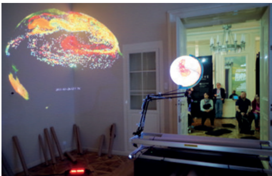
► Az írek fényjátéka