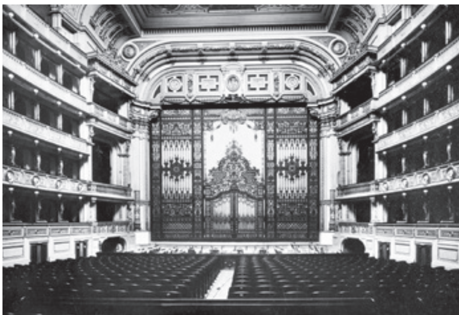
► A Wiener Hofoper vasfüggönye

la Franke bécsi kurátornő nem időrend szerint, hanem olyan nagyobb témakörökbe rendezte az anyagot, mint a mediterrán hatás, a vallás, a háború, a demokrácia, a nemzeti öntudat vagy a színházépítészet. A hat város mindegyike a maga színházi tradíciójában legerősebben élő karaktert tette hozzá az egészhez, a bécsieknél például a Ringtheater 1881-es leégése külön fejezetet kapott, mivel ez hozta magával az új színházi törvény megszületését, s vele a szigorú biztonsági intézkedéseket a már működő és a jövőben építendő színházakra nézve. Hamarosan Európa-szerte ilyen biztonsági szabályok léptek életbe, és ezek egyfajta általános, tulajdonképpen máig érvényes színházi sztenderdet honosítottak meg. Így lett a tragikus bécsi éjszaka az európai színházépítészet következő korszakának kiindulópontja. A Theatermuseum gazdag gyűjteménye a kiállításon belül a színházváros Bécs kultúrájáról adott képet, ahogyan a londoni, varsói és a többi részt vevő város is a saját színháztörténelmi momentumait emelte ki.