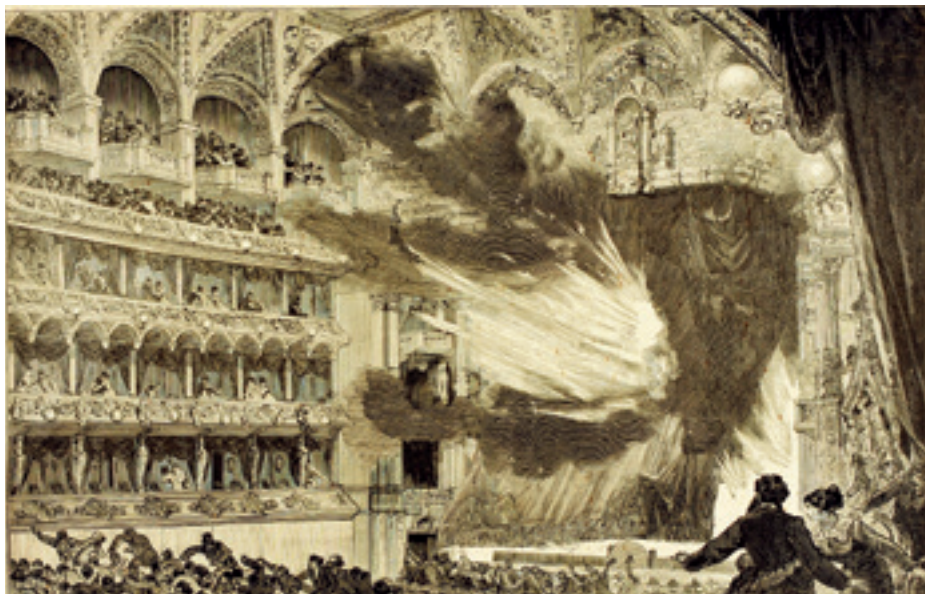
► Korabeli sajtóillusztráció a Ringtheater leégéséről, 1881

A tárlat 2015 októberétől idén márciusig a bécsi Theatermuseumban volt látható. Danie-