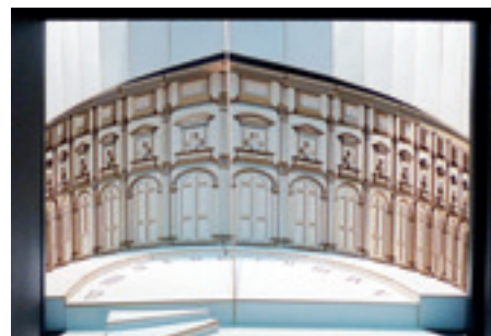
► Szakács Ferenc a Miskolci Nemzeti Színház nagyszínpadára a Dürrenmatt: A nagy Romulus darabhoz tervezett díszlete. Romulus villája olyan árnyékbirodalomként jelenik meg, amely ellentmond a keretes színpadok törvényszerűségeinek. A közepen lévő napóra a felgyorsult napszakok változását mutatja a világítás segítségével