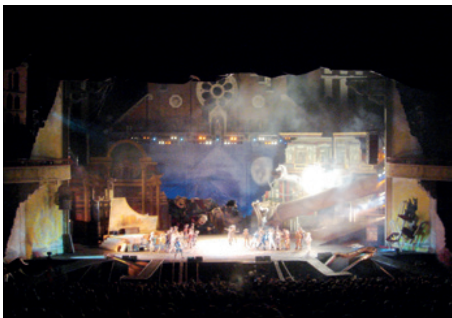
► Szegedi Szabadtéri Játékok, 2006

Harminc év múlva, egy délelőtt, színházunk üres előcsarnokában kereszteltük egymás útját a kissé megfáradt, 80-hoz közeledő koreográfussal. Tolnay Szalonunkban az előző napokban nyílt meg a 70 éves születésnapomra rendezett kiállítás. Seregi végignézte a tablókat, kérdezgetett, hallgatta kommentárjaimat. Jó, csendes percek voltak.