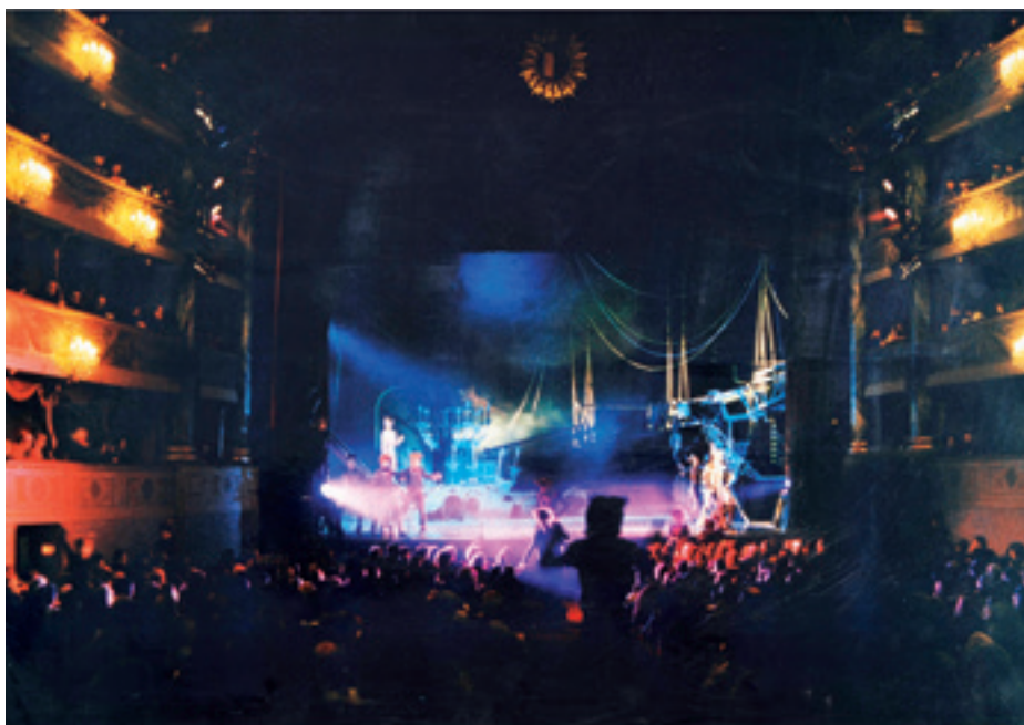
► Vendégjátékunk Olaszországban. Bergamo, 1990

A nézőtér mellvédjeire bársonykárpitok kerültek, a proscénium két oldalnyílását aranyozott, csonka aktszobrokkal keretezett páholyokká alakítottam. Balra még egy sittyledobó futószalag is került (Szerednyeinek), a szembülső páholy szájából egy hatalmas lyukas fenekű szék lógott ki (innen bújt elő Paudits Béla). A színpadnyílást a szakadt előfüggöny-maradvány mögött barokk színházakban használatos festett cortina takarta, a nyitány alatt egy macska leszakította. A zene akkor még magnóról szólt, ma már kötelezően élő zenekar kíséri az előadásokat. Megszólalásakor a sötétben a nézőtér sok-sok pontján macskaszemek villantak fel. Ezt mi már, sokkal előbb hatást keltve, az időközben megszületett új technikával, az elektronikával vezérelt LED-ekkel oldottuk meg →