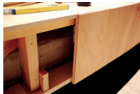
► Hangversenyterem, mellvédburkolat szerkezeti kialakítása

→ nek burkolva. Mivel eredetileg sima dekorlemez burkolat volt a felületeken, méretezésbeli problémák is felléptek az új tervezés miatt, de a vállalkozó sikeresen megoldotta azokat. Ugyancsak nehézséget jelentett az élek lezárása, ennek a megoldása is hosszas egyeztetés eredményeként született meg. A tervező ragaszkodott volna a vastag élzáróhoz, de végül sikerült meggyőzni, hogy jobban járunk a vékonyabb élzáró lécekkel, mert ezek pótlása, cseréje egy sérülésnél lényegesen egyszerűbb és gazdaságosabb megoldás.