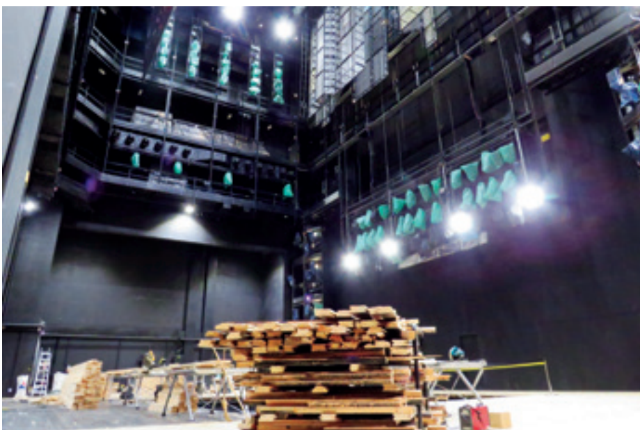
► Fesztivál Színház, színpadtér a bontott és új anyagokkal, a becsomagolt scenikai fényvetőkkel

Az oldalszínpadon a teherautó-plató jó vá- →