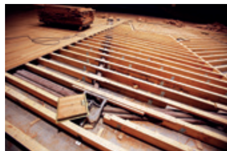
► Hangversenyterem, padlóbontás, a párnafarendszer és a padlócsapda a rejtett csövezéssel

a korábbival, csupán a színe változott, a keményebb, ezáltal sötétebb parketta miatt, aminek a színe még az olajozás hatására is egy árnyalattal sötétebb lett.