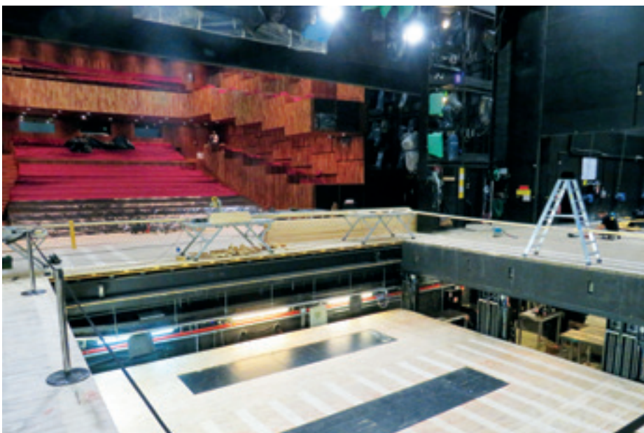
► Fesztivál Színház, a kész utcasülyedők a személyi emelők fedeleivel