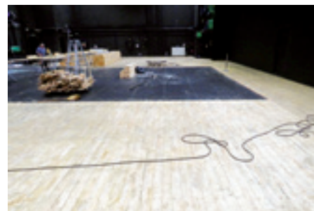
► Fesztivál Színház, a kész főszínpaddal és a még régi burkolatos utcasülyedők

gyásra. A faanyag, mivel sikerült időben megrendelni és legyártatni, már egy jó hónappal a munkálatok megkezdése előtt beszállításra került az oldalszínpadra, hogy akklimatizálódni tudjon.