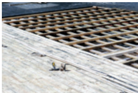
► Fesztivál Színház, főszínpadi padlólerakás