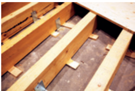
► Hangversenyterem, párnafa-megerősítés