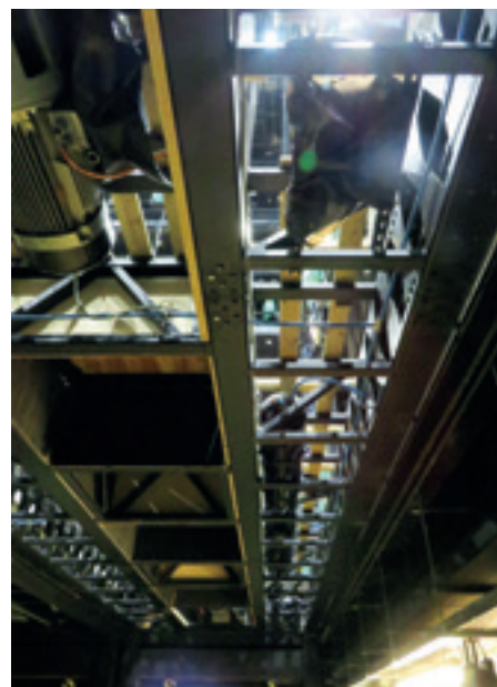
► Fesztivál Színház, a színpad alulról