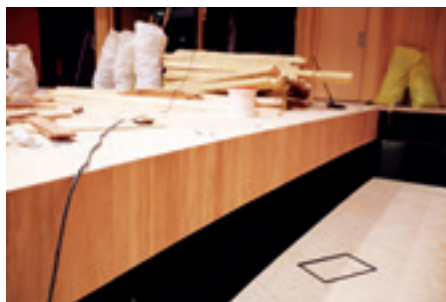
► Hangversenyterem, mellvédburkolat parkettából