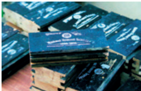
► Színpadpadlók emlékébe

„Na, sziasztok, megyek a megtisztelő padlóra” – mondta kislányunk nyolcévesen, mikor a Miskolci Nemzeti Színház A dzsungel könyve c. előadásában szerepelhetett. Természetesen a „világot jelentő deszkák” lett volna a helyes kifejezés, csak az nem ugrott be neki hirtelen, így „költött” másikat. Most pedig – majd’ tíz év elteltével – szép emlékként ebből a padlóból kerülhetett egy darabka a polcára.