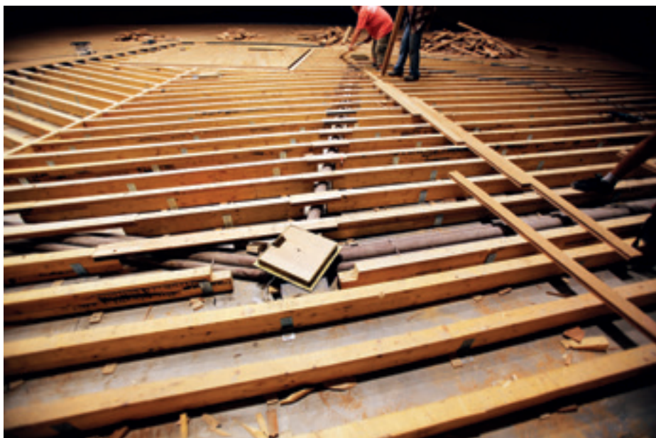
► A Bartók Béla Nemzeti Hangversenyterem padlóbontása, középen a zongoralift, előtt az I-es bővítménnyel, ami lehet színpad, nézőtér vagy zenekari árok