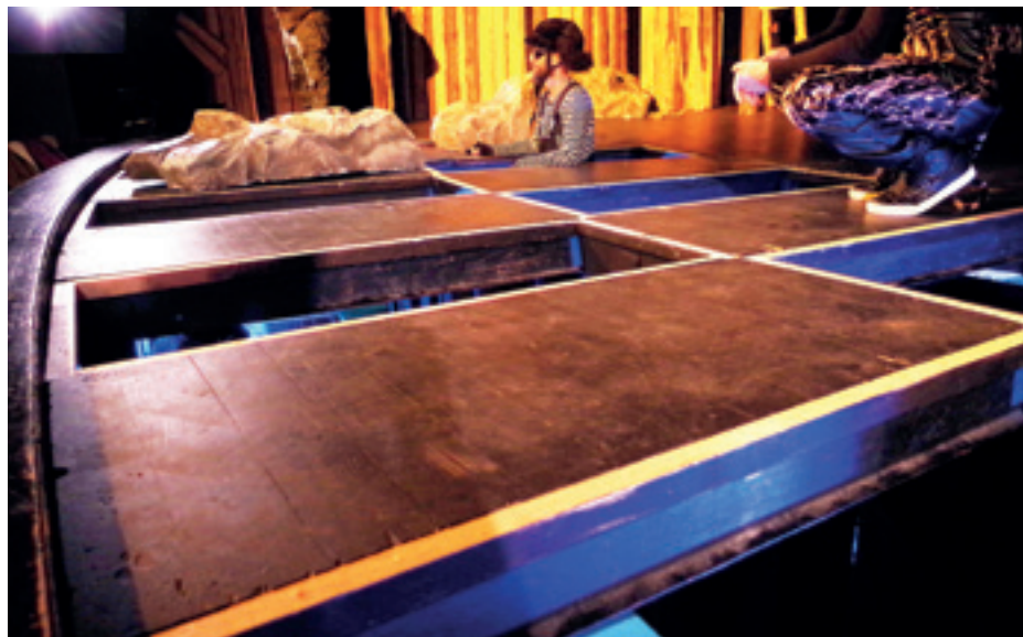
► Sokféleképpen „alakítható” előszínpad (jelenet a Csipike , az óriástörpe c. előadásból)