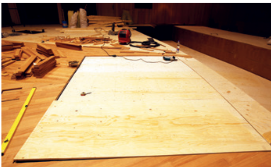
► Hangversenyterem, parkettaragasztás