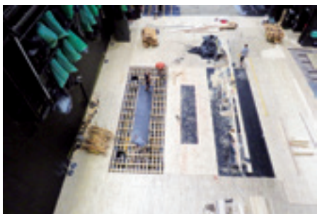
► Fesztivál Színház, a színpad a karzatokról a készülő utcasülyedőkkel