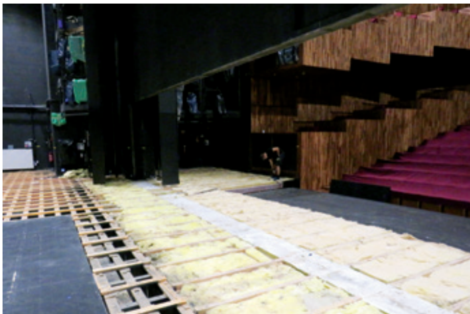
► Fesztivál Színház, főszínpadi padló bontás

A színházteremnél, mivel az eredeti kivitelezési technológiától a főszínpadnál nem térünk el, nem volt szükség sem az építés, sem akusztikus bevonására, így elég volt egy kiviteli leírást és tervet készítenünk a kivitelezővel jóváha-