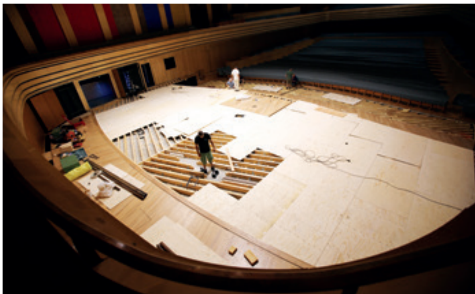
► Hangversenyterem, réteglemez fektetése a megerősített párnafarendszerre, háttérben a kóruspódium-emelővel

A bontás során kiderült, hogy több párnafa rögzítése is meglazult az évek alatt, ezért lényegében – a további lazulását is megelőzve – az összes párnafarögzítés megerősítésre került. Ezek után következett a réteglemez felcsavarozása, majd a parketta felragasztása. A parkettafektetés mintázata megegyezett az eredetivel, tehát vizuálisan a színpad azonos