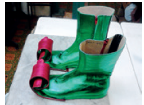
▶ A Parázsfulválcska szöcskeláblébjelje