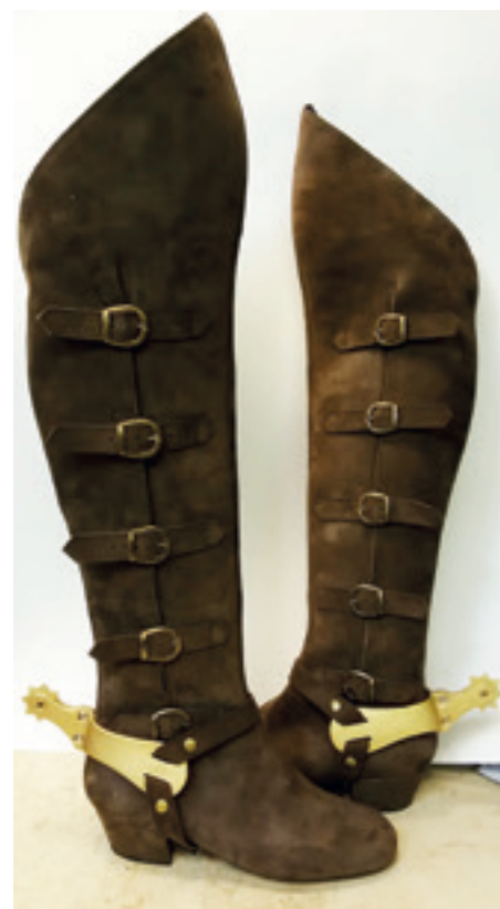
► Don Quijote csizmája

megfelelő, akkor azt használja. Ha a cipő már nem jó a művész lábára, természetesen új kaptafa, új cipő készül. Amennyiben a szereposztás változik, akkor az új művész számára mindentől újat csinálunk.