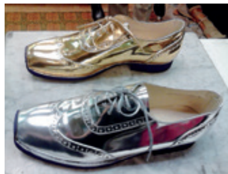
▶ A kéjenc útja egyik különlegessége

Egy új bemutató kapcsán, legyen az akár opera vagy balett, a szituáció mindig ugyanaz. A darab jelmeztervezője lerajzolja a szereplők ruhadarabjait és a cipőket, a kivitelezővel eljön a műhelybe, ahol megbeszéljük a feladatokat. Ilyenkor állítjuk össze a szükséges kellékek listáját: bőr, paszomány, heveder, masni stb. Ezeket beszerzik. Megmondom, hogy melyik művésznek nincs vagy már nagyon régi a cipőmérete. Ezeket a művészeket beküldik a műhelybe méretet venni. A jelmeztervező elmondja szereplőnként, hogy kinek milyen cipőt szeretne. A balettnél a koreográfussal is egyeztetnek. A szereposztás szerint megbeszéljük az igényeket, kiválasztjuk a bőrt. A baletthez vékonyabb, nagyon puha kesztyűbőrből készítjük a cipőket, hogy minél puhább, lágyabb lehessen a lábbeli. Az operához másfajta bőrt is használunk, a színpadi mozgástól függően. A következő lépés a beszerzés, ahol szeretek jelen lenni, főleg a bőrök megvételénél. Az anyagbeszerző többnyire csak szín szerint választ, de a bőr minőségét nem figyeli. Én segítek eldönteni, hogy a feladathoz a megfelelő bőrt vegyünk meg. Az általánosan használt anyagokat, cérnákat, ragasztókat, varrótüket stb. a