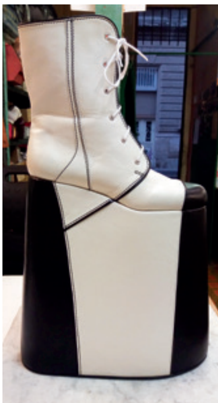
► Kotornusz a Vihar című operából

Az elkészült cipőket az öltöztetők átveszik, és a jelmezzel együtt a jelmeztárban tárolják. Amennyiben egy-egy előadás lekerül a műsorról, a cipőket a raktárban a jelmezekkel együtt őrzik. Ha a produkció újra előadásra kerül, ugyanabban a szereposztásban, akkor a művész felpróbálja a régi cipőjét, és amennyiben