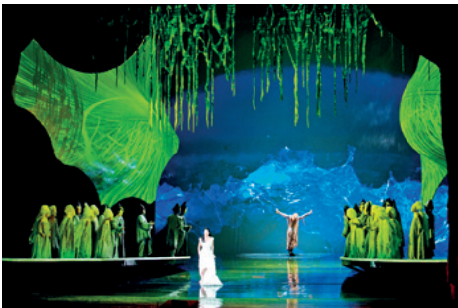
► Rameu: Hyppolite és Aricie , Magyar Állami Operaház, 2013

Végezetül szeretnék bemutatni egy olyan összetett projektet, amely vetítéstechnikai újdonságnak számított, nem csak hazánkban. 2016 októberében került sor Bartók Béla: