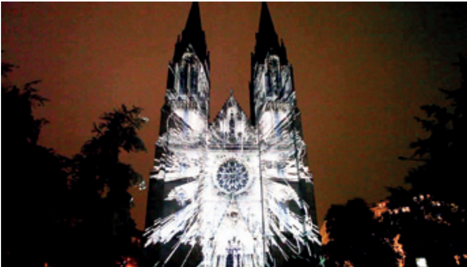
► Signal Festival, Prága 2015

A mai vetítéstechnika egészen új lehetőségeket teremt. Ezekből ismertet egy válogatást a szerző, saját munkáin bemutatva a videoprojektorok művészi alkalmazását a színpadokon.