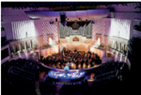
► Rubinstein: Daemon , Csajkovszkij Hangversenyterem, Moszkva, 2015