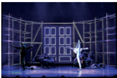
► Páneurópai Piknik, Soproni Petőfi Színház, 2014