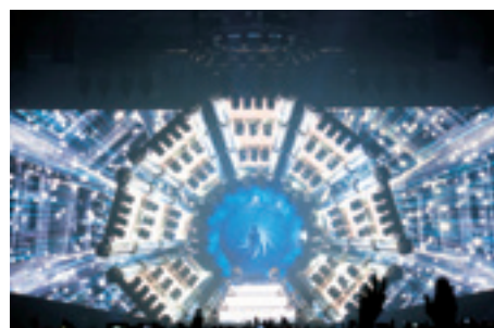
► Timeless 2013 nyitókoncert, Párizs

„snap to vertex” eljárással igen könnyűvé vált a pontthalmazalapú 3D modellezés. Korábban a pontfelhő feldolgozása rendkívül nehézkes volt.