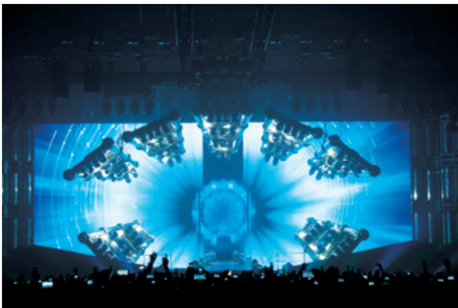
► Mylene Farmer énekesnő párizsi nyitókoncertje a Timeless 2013 világtorné alkalmából

Jelen esetben 1 cm pontossággal dolgoztunk, hogy elkerüljük az óriási adathalmazt. Tóth Gábor barátom végezte el a lézerszkennelést, utána egy 3D-s modellt készítettem a 3D Studio Max nevű szoftver segítségével, amelyben 2015 óta van pontthalmaz-támogatás, és az úgynevezett