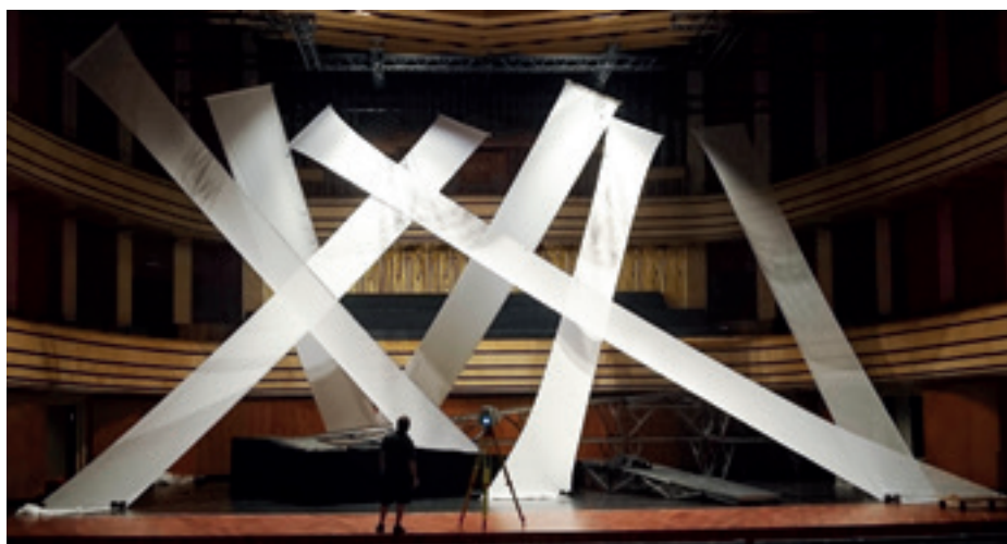
► Bartók Béla: A kékszakállú herceg vára díszlete, Müpa. Díszlettervező: Szendrényi Éva

hogy Bartók szellemében jóval erőteljesebb és elvontabb vizuális megoldásokat kerestem, de sajnos nem tudtam átvinni a rendezői koncepciót, amely a szerteágazó értelmezés lehetősé-