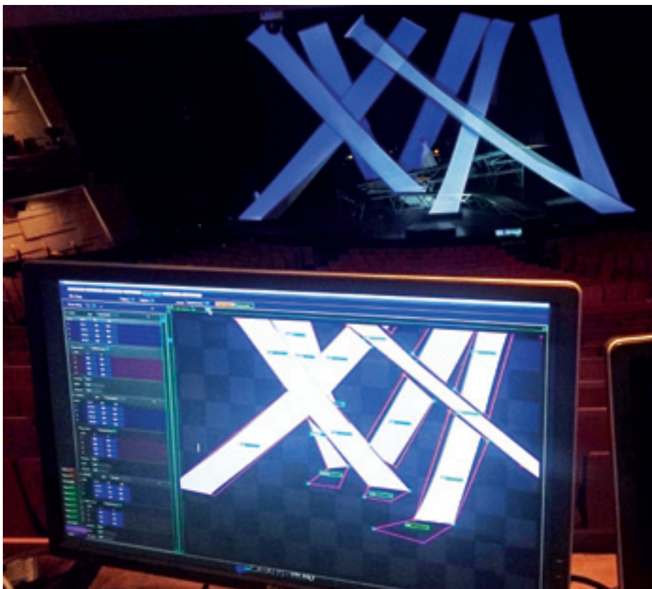
► Helyszíni igazítás Catalystral

Viszont ne felejtsek el azt sem – és itt engedtesék meg nekem egy konstruktív kritika –, hogy a projektorok fényerejének a növekedése még mindig nem tudja túlszárnyalni a világosítását. Szeretném megkérni a világosító szakembereket, hogy a vetítéses produkciókban közösen keressük a jó megoldást, ugyanis a Kékszakállú bemutatóján is akadt egy kis probléma, a 30 000 Ansi Lumen-es projektor fényereje lényegében felére csökkent a színpadi fények miatt.