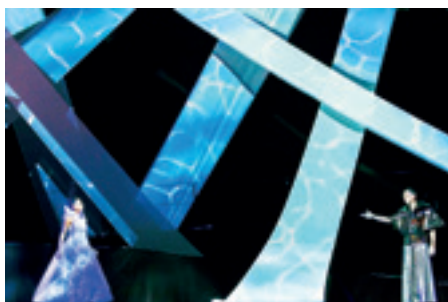
► Jelenetek A kékszakállú herceg vára operából