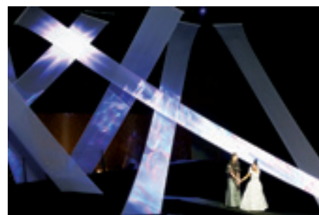
► Bartók Béla: A kékszakállú herceg vára, Müpa, 2016

Viszont ne felejtsek el azt sem – és itt engedtesék meg nekem egy konstruktív kritika –, hogy a projektorok fényerejének a növekedése még mindig nem tudja túlszárnyalni a világosítását. Szeretném megkérni a világosító szakembereket, hogy a vetítéses produkciókban közösen keressük a jó megoldást, ugyanis a Kékszakállú bemutatóján is akadt egy kis probléma, a 30 000 Ansi Lumen-es projektor fényereje lényegében felére csökkent a színpadi fények miatt.