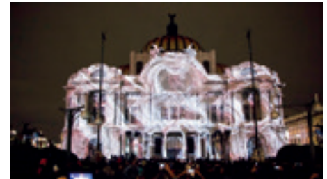
► Filux Festival – Mexico City 2015