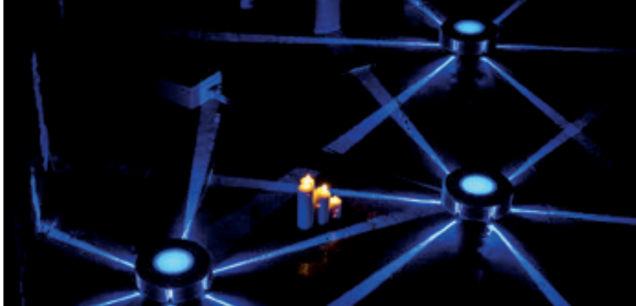
► A Vivosol fénymintái és a gyertyafény mutatták az utat a lépcsőházban