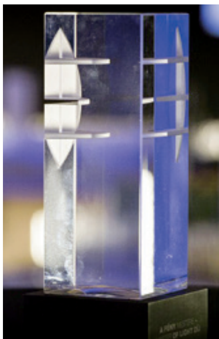
► A FÉNY MESTERE 2016 üveg emlékdíj LED megvilágítással (Botos Péter alkotása)

A szeptemberben meghirdetett pályázat idén a Design és a Fénytechnikai tervezés különdíjakkal bővült. Ezeket a díjakat a Magyar Belsőépítész Egyesület (MABE) és a Magyar Mérnöki Kamara Elektrotechnikai Tagozata (MMK ELT) támogatta. Az energiatudatos világítástechnikai