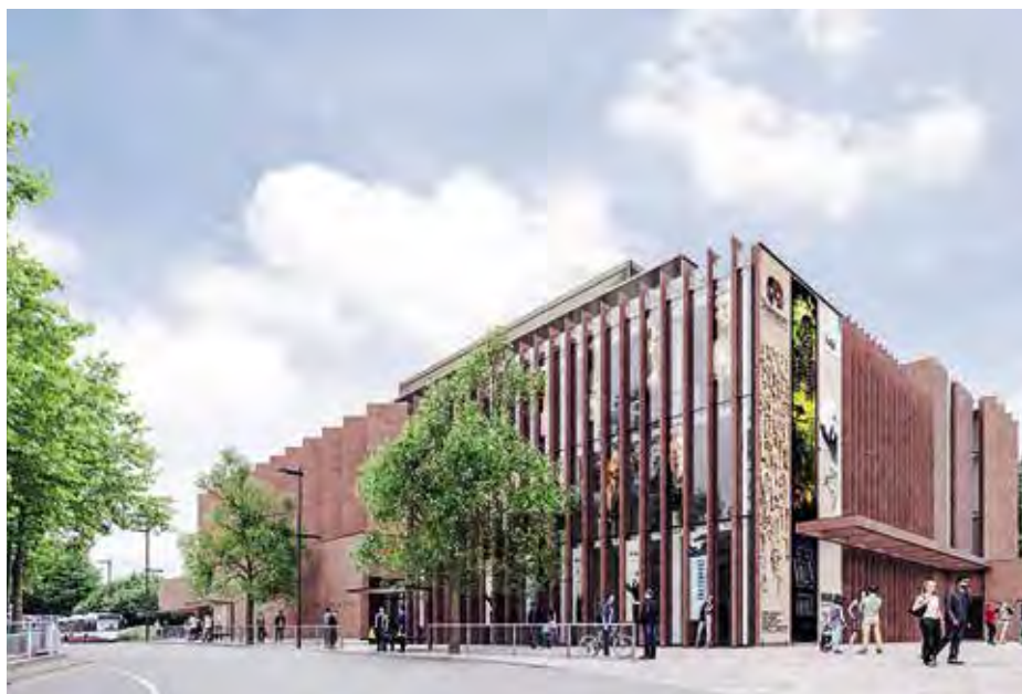
A kívülről kortárs megjelenésű színházépület

Tavaly nyár közepén nyílt meg a Liverpool melletti Prescotban Nagy-Britannia egyik különleges új színháza, a Shakespeare North Playhouse. Londonon kívül ez az egyetlen hely, ahol 17. századi stílusú faszínház működik. A Shakespeare örökségét képviselő, játszóhelyet és oktatási központot egyesítő színház középpontjában VIII. Henrik londoni, Whitehall-beli palotájának kakasviadalokra szolgáló arénájának, a Cockpit-in Court-nak a replikája áll, amelyet a korabeli Anglia egyik leghíresebb építésze, Inigo Jones alakított színházzá.