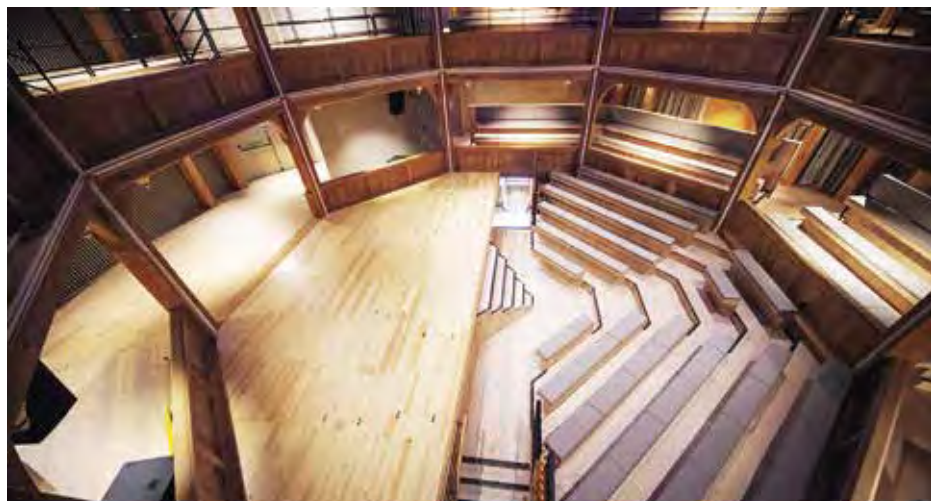
Az egyszerű, díszítetlen faszervezetbe foglalt színpad és nézőtér