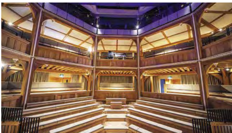
A fából ácsolt nyolcszögletű színházbelső

A Shakespeare North Playhouse-t a városnak Shakespeare-hez fűződő történelmi kapcsolata és a történetmesélés szeretete ihlette. Az épület 2022 júliusában nyitott meg, és sokféle módon szolgálja ki a közönséget: színház, oktatási központ, közösségi színtér és kulturális fesztiválokat befogadó hely egyszerre. A szervezők nemzetközi