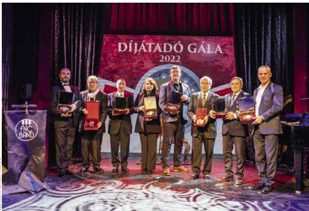
Az ünnepélyes díjátadó

állapotának megőrzését, valamint az üzemeltetésének feladatait külön üzemeltetési igazgatóra bízták. Engem neveztek ki erre a posztra. Korábban ez is a műszaki igazgató feladata volt, ezt követően a műszaki igazgató a színpaddal és az előadásokkal kapcsolatos műszaki feladatok irányítását látta el. Az üzemeltetési igazgató az épület hibátlan működéséért felelt. A feladatomból volt a színház épületének működését biztosítani, a portától a klí-