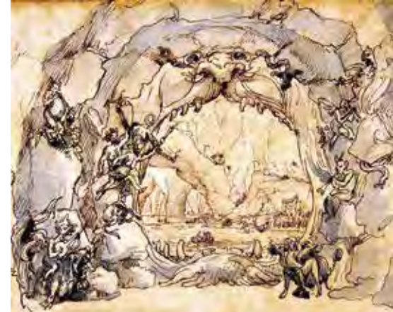
Zenélő ördögök a Pokol kapujában, jezsuiták számára készült színpadterv, 1700 körül. Országos Színháztörténeti Múzeum és Intézet Szenekai Gyűjteménye

Ahogy a görög színházban maszkokban játszottak a színészek, ugyanúgy mi is használtunk újságpapírból magunk készített csákókat, maszkokat, pajzsokat és fakardokat. Játék volt ez, anélkül, hogy tudtuk volna, mit is jelent a színjáték, a színház. De az sem okozott problémát, hogy egyetlen műanyag özikével kellett bábelőadásaink minden állatfiguráját eljatszanunk.