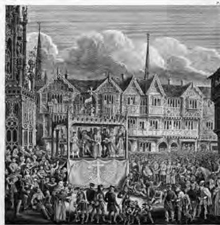
15. századi passiójáték Coventryben, a Kovácsok Céhének előadásában, David Gee 19. századi metszetén

Gyermekkoromban mindenféle tudatosság nélkül játszottunk ős-színházat. Mi is festettünk a falra, énekelünk és táncoltunk hozzá – elsősorban azért, hogy ne kelljen még lefeküdni a sötét szobában. Kihasználtuk az akkoriban még gyakori áramszüneteket is: a petróleumlámpa árnyékában furesa, izgalmas árnyjátékokat játszottunk.