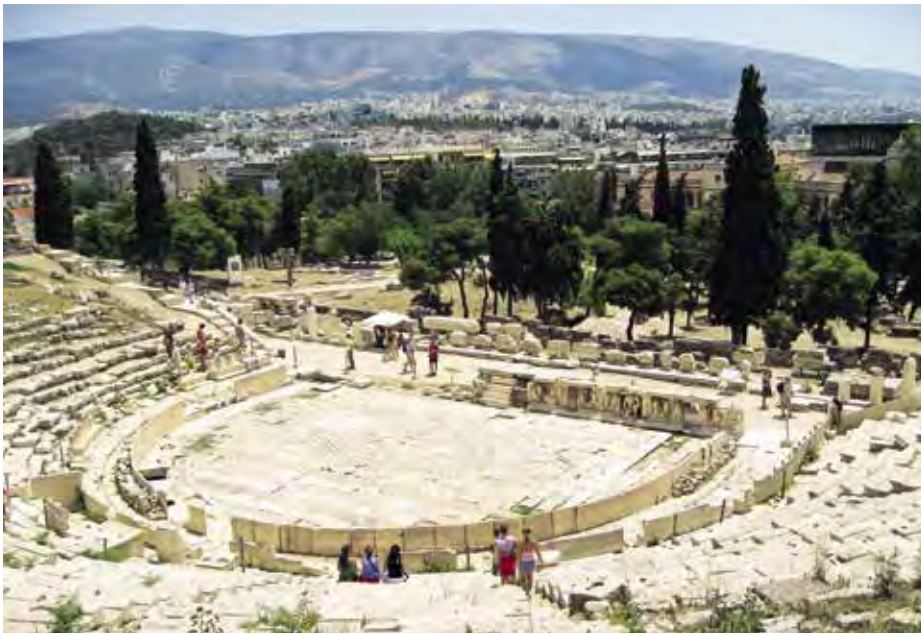
Az ókori athéni Dionüszosz színház

Hagyományosan a színházaknak kilenc „típusát” különböztetjük meg. A típust idézőjelbe tettük, mivel a színház gazdaságtörténetében nem tipizálhatók úgy a színházak, mint akár a művészettörténetben. Éppen ezért gyakran fordulunk segítségért, amikor nem tudunk elég jól értelmezni szempontunk szerinti színházi fogalmat. Cikkem tárgya az európai színház rövid gazdaságtörténete.