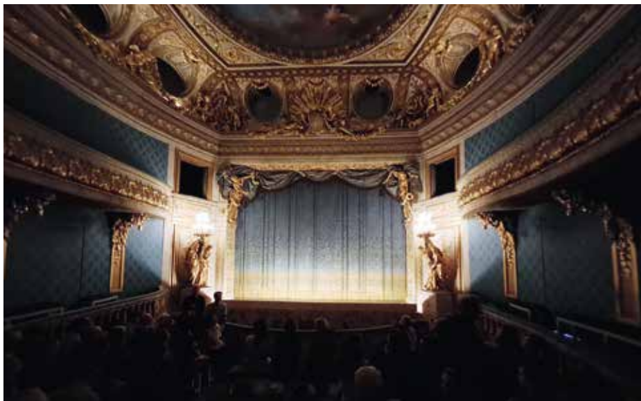
A Királyné Színháza a Kis-Trianonban

A háromnapos tanácskozás második és harmadik napján párhuzamos szekciókban folytatódtak az előadások immár Versailles-ban, a királyi kastély főbejáratához vezető sugárúton található Barokk Zenetudományi Központ termeiben. A szervezők az egy időben zajló szekciókat videón rögzítették, hogy utóbb a konferencia résztvevői hozzáférhessenek azokhoz a prezentációkhoz is, melyeket kénytelenek voltak elmulasztani. A keddi napon került sor a tudományos konferenciákon szokatlan, de a színházkutatás körében új lehetőségeket biztosító „vásár” pultjainál, asztalainál a gyakorlati projektek bemutatására. A rendelkezésre álló kilencven percen a két konferenciateremben elhelyezett tizenhárom asztalnál az előre egyeztetett technikai eszközökkel a színházkutatáshoz, a színházi dokumentációhoz és archiváláshoz, a virtuális rekonstrukciókhoz kapcsolódó prezentációk és könyvbemutatók zajlottak. Így az adott projekt előadói nem csak húsz percen,