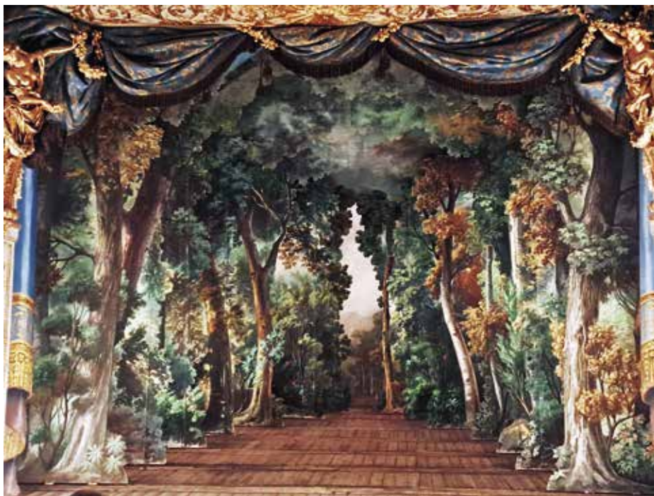
Barokk díszlet a Királyné Színházának színpadán

hanem gazdag vizuális illusztrációk segítségével lényegében a teljes másfél órát kihasználva mutathatták be a kollégáknak a munkájukat.