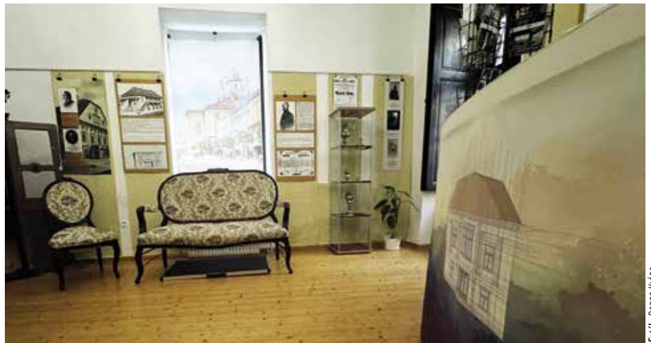
Felújítási tervek a „...a kezdet megvolt” c. tárlaton

A múzeum pincéjében kialakított kiállítótér, a Veres Attila terem névadójára emlékeznek 2024 őszén: születésének 90. évfordulóján a színházi