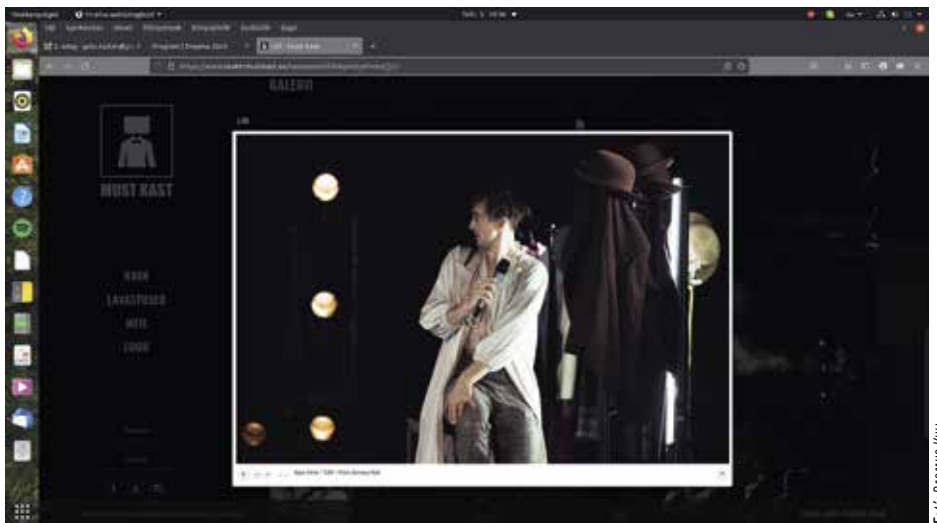
Lilli, a Teater Must Kast előadása