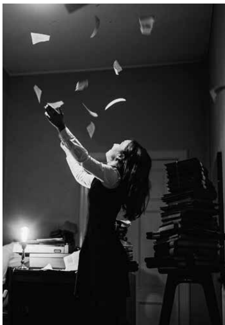
Business as Usual, az Észt Drámai Színház előadása

Az Európába – a cári Oroszországból való 1918-as kiszakadás után 1939-ig fõnállt függetlenségének visszaszerzése (1991) után – lendületesen beilleszkedõ, az uniós és a NATO-tagságot 2004-ben megszerzõ Észtország polgárai mind