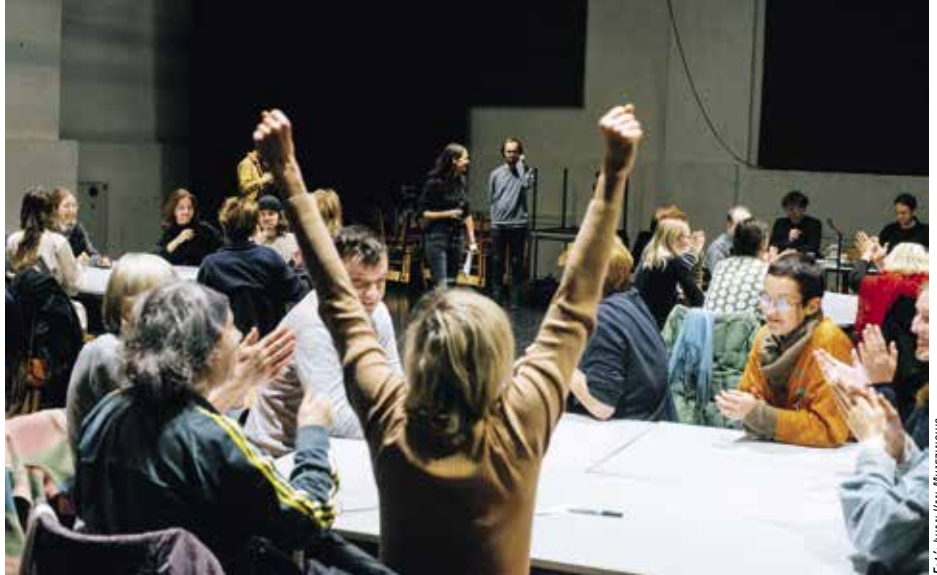
Fun Facts, a Kanuti Gildi SAAL előadása

A legérdekesebb és a leginkább elgondolkodtató előadások között mindenképpen említést érdemel az Észte Drámai Színház Teorema (Teoreem) című szürreális Pabolini-adaptációja 11 korunk emberi kapcsolatairól és az emberi és az isteni, a földi és a szellemi létezés feszültségeiről. A szexualitás, a család, a megélhetés, a munka szimbólumai korokon és kultúrákon keresztül kapcsolják össze a mai problémákkal küzdő egyént az antik görög, a keresztény és a modern polgári civilizáció azonos kérdéseivel, és adnak partikuláris s egyúttal egyetemes, univerzális választ a legfőbb egzisztenciális kérdésre: van-e és kicsoda az isten, mivégre a teremtés, kik vagyunk mi, egyszeri és megismételhetetlen, ugyanakkor megismerhetetlen emberek? Az előadásban a Vendég masz-