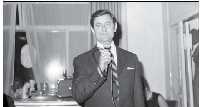
Rendezvény művészvendége a Pipagyújtó Csárdában a 70-s években