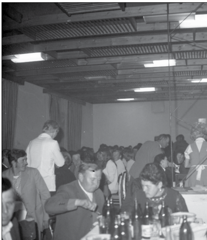
Figyelemre méltó a mennyezet akkor modern stílusú burkolata