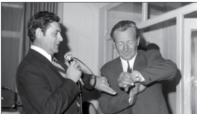
Vajon itt mi lehetett a feladat?