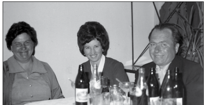
Erre az estére külön frizura készült!