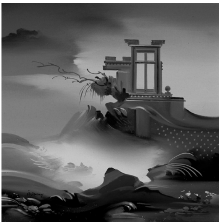
Az utolsó ablak

persze, így legalább nem felejtettem semmit nálad miről való lemondásom bepiszkítná e szép emlékezést, csakhogy.. csakhogy mi? valaki úgy ismert rád a hír hallatán: 'az a kopasz lány, tudod' nehéz visszafelé beszélni a lehetőségekről múlt idő és feltételes mód nélkül na és a szavak melyek kétoldalt néznek rá a bének visszafelé még megadatik egy space az ess másfél miliméter csupán és közvetlenül ennyit az ablakokról és macskákról na meg a kockákra butított vérről ami kívül esik a képen arra nem exponálunk és többnyire kívül esik mert oly gyorsan kéne akár a halál exponálás tétovázás nélkül szobahőmérsékletű bizalommal