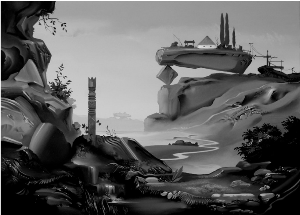
Az otthon szigete

Azt gondolom minderről: hinnünk kell az ötvenéves költőnek, s hagynunk szabadon keresztüláramlani testünkön a világot, kellő teret engedve magunkban az alázatosságnak s kellő súlyt adva az önismeretünknek, és – minden tiszta lesz, szép lesz, könnyű és őszinte, mint a pillangó.