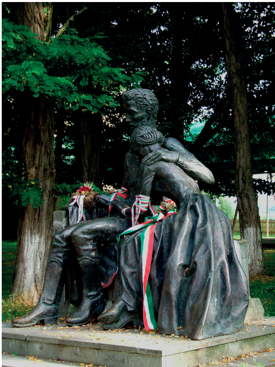
Petőfi Sándor és Szendrey Júlia szobra Máramarosszigeten