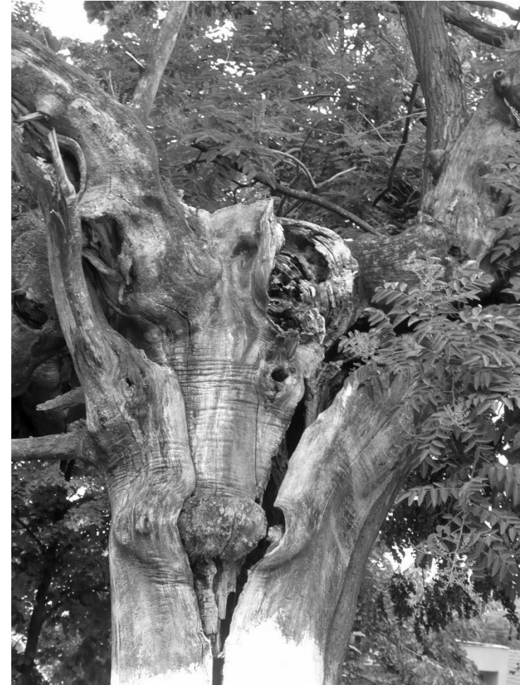
A fotó Oláh András: Átváltozás című felvétele

„komolyabb fényképezőgépe” lenne...) Oláh András 2019. Szent István ünnepén Pro Urbe díjat vehetett át. A díjazók észrevették a Másikat.