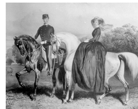
Az ifjú Erzsébet és Ferenc József egy kislóval alkalmával (nem Magyarországon készült a kép). Készítője: Eduard Kaiser. (Osztrák Nemzeti Könyvtár, No.: NB 502.896 – B)

Ferenc József ifjú feleségével, a bajor Wittelsbach-ház egyik mellékágából származó Erzsébettel, valamint két kislányukkal, Zsófiával és Gizellával 1857 májusában látogatott először Magyarországra. Arany Jánost kérték fel, hogy írjon a császár-király köszöntésére egy dicsőítő költeményt. Az erősen nemzeti érzelmű, hazaszerető Arany betegségre hivatkozva visszautasította ezt a „megtiszteltetést”, de hamarosan elkezdte írni A walesi bárdok című balladáját a véreskezű uralkodó első magyarországi látogatásának allegóriájaként: „Edward király, angol király/ Léptet fakó lován:/ Hadd látom, úgymond, mennyit ér/ A velszi tartomány.”// Van-e ott folyó és földje jó?/ Legelőin fű kövér?/ Használt-e a megöntözés:/ A pártos honfivér?// S a nép, az istenadta nép,/ Ha oly boldog-e rajt/ Mint akarom, s mint a baram,/ Melyet igába hajt? (...)”