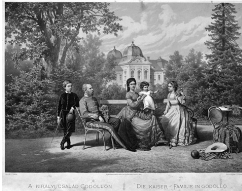
A királyi család a Gödöllői Királyi Kastély parkjában 1868-ban (balról jobbra): Rudolf trónörökös, Ferenc József, Erzsébet a kis Mária Valériával és Gizella főhercegnő.

A királyné gödöllői udvartartása hasonlított a szüleinek possenhofeni udvarához. Itt olyanokkal vette körül magát, akik a császárvárosban nem kerülhettek volna a közelébe. Nagyon szerette volna Batthyány Lajos családját is megismerni, azonban Zichy Antónia Habsburg-ellenes szellemben nevelte a gyermekeit. Lánya, Ilona soha nem volt hajlandó találkozni a királynéval – habár kastélya a