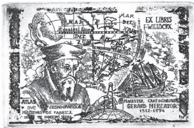
Ürmös Péter ex librise – rézkarc, akvatinta (1992)

A lét most már kisbetűs neked, riadt kis jószág lettél, önérzet-vesztett nemecsek . Az észpróbát kiálltad, mégis apokrif maradsz, rejtett kinyilatkoztatás egy soha nem olvasott könyvben.