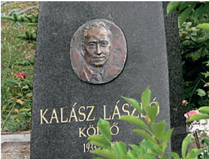
Domborműves síremléke a perkupai temetőben