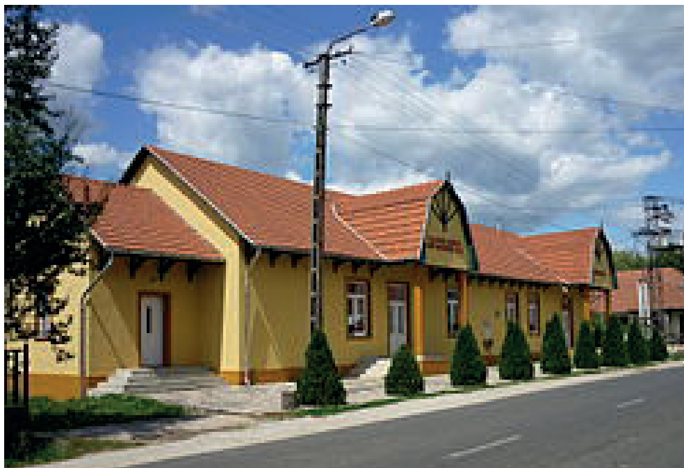
Kalász László Művelődési Ház, Perkupa