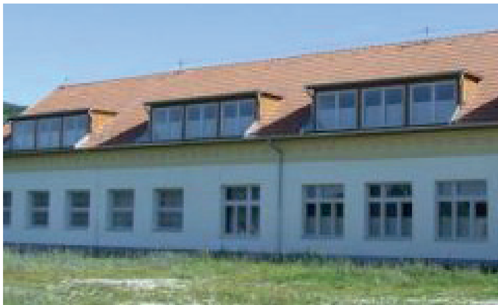
Kalász László Általános Iskola, Szalonna