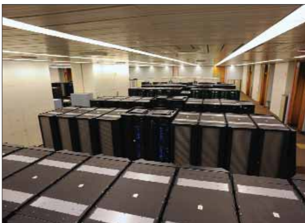
2. ábra Az ECMWF-ben működő egyik „IBM POWER6 Cluster 1600” szuperszámítógép klaszter.

A numerikus modellek futtatása rendkívül számításiigényes, csak szuperszámítógépekkel képzelhető el. Az ECMWF-ben jelenleg a szuperszámítógépes rendszer egy új fázisának megvalósítása van folyamatban. Ennek részeként két egyenértékű „IBM POWER6 Cluster 1600” rendszer (klaszter) van üzembe állítva, amelyek egyenként 286 darab „pSeries p6-575” többprocesszoros szerverből állnak (2. ábra). A szerverek 32 processzort tartalmaznak, amelyek nagy része 64 GB memóriával rendelkezik, így klaszterenként kb. 8700 processzor és kb. 20 TB memória áll rendelkezésre. A két egyenértékű rendszer nagyfokú üzemelési biztonságot tesz lehetővé. Az egyik mindig teljes értékű operatív üzemmenetet tud biztosítani, bármi is történjen a másik