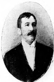
Meszaros János „Korona“ szálloda, Kiscell.