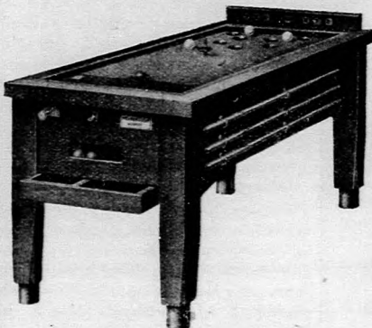
Külméret 90×180 cm.

Kertibútorok , fa-, vasszékek, asztalok kosárszékek, kertiernyők!