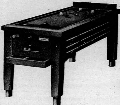
Külméret 90×180 cm.

Kertibútorok, fa-, vasszékek, asztalok kosárszékek, kertiernyők!