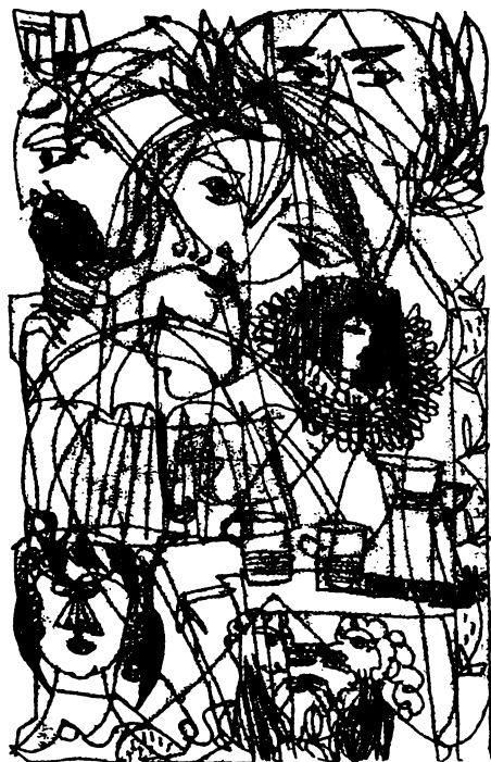
Szántó Piroska illusztrációja Eliot gyűjteményes kötetéhez