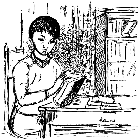
Monos József rajza

Hírek 32, 88, 94, 152, 213, 314, 280, 342, 343, 344, 407; 408, 471, 472, 536, 664, 666, 730, 732