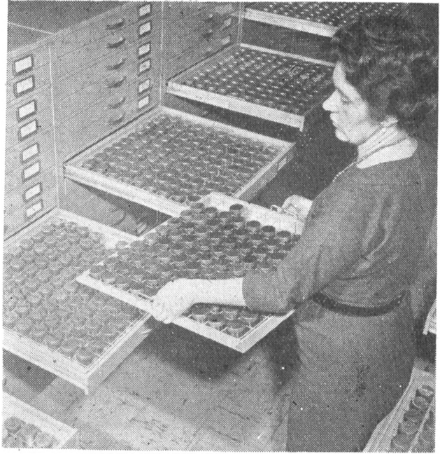
Részlet a mikrofilmtárból

A York meletti Boston Spaban létesített könyvtárban 32 kilométer hosszú polc-területen már az induláskor 350 000 kötet válogatott tudományos könyv és 109 országból származó 12 000 kurrens folyóirat kapott otthont. A mikrofilmtárban a megnyitáskor 75 000 olyan tudományos könyv mikrofilmjét őrizték (200 ezer kilométer hosszú filmszalagon), amelyből egyáltalán nem található példány Angliában.