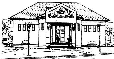
A könyvtár homlokzati képe

A könyvtár épülete is tönkrement: a falak vizesek, a nedves padló elkorhadt, 1918-tól kérik a könyvtár tatarozását, de nem kaptak rá pénzt. A nemrég még európai nivón álló könyvtárról Az Újság 1925-ben már így ír: „Kint rongyos, kopott, foltos, belül mégis nagyon hasznos. Mi ez? A könyvtár tetőzete elkorhadt, a cserepeket széthordta a szél, az ablakai be vannak törve, a falak omla-