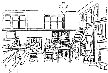
A felnőtt kölcsönző egyik részlete