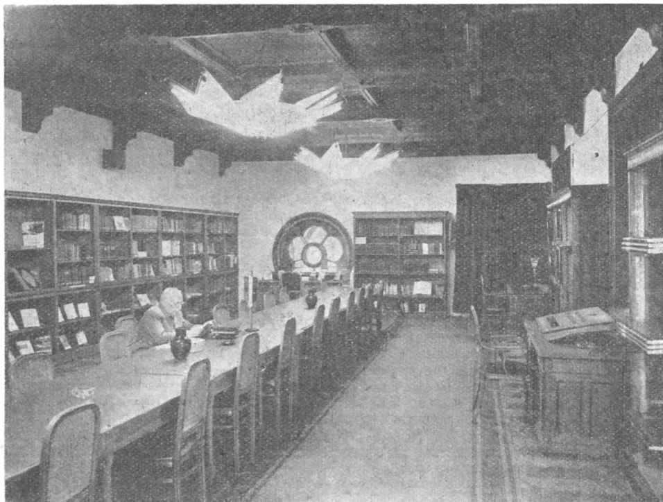
Az Országgyűlési Könyvtár egyik olvasóterme

Allománya 1872-től számottevő, ekkor Ghyczy Ignácnak, az Országos Magyar Gazdasági Egyesület egyik alapítójának gyermekei a parlamentnek ajándékozták elhunyt apjuk 15 000 kötetes, jogi és történelmi művekben, hazai és külföldi folyóiratokban, régi hungarikumokban bővelkedő könyvtárát. Ettől kezdve az állomány szépen gyarapodott — a húszas évek közepén elérte a százezer kötetet —, a képviselőház minden évben jelentékeny összeget szavazott meg gyarapítására, a külföldi parlamenti kiadványokból cserepéldányokat kapott, és 1922 óta a kötelesepéldányokból is válogathatott.