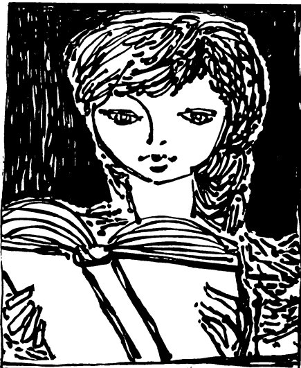
AZ OLVASÁS MEGSZÉPÍTI ÉLETÉT

A könyvtár és az olvasás iránti figyelemfelkeltés esetében is tudatosan kell alkalmaznunk a szokatlant, az újszerűt. De meggondoltan bánjunk ezzel az eszközzel. Az újszerű és szokatlan módszerek konkrét megjelenési formáit a propaganda-eszközöket készítő könyvtáros maga választja ki. Általános érvényű tapasztalat, hogy a látszólagos diszharmonia, a túlzás, a ritkán előforduló forma stb. szintén az újszerűség benyomását kelti. A szokatlan azonban a különböző olvasórétegek más-képpen reagálnak. Az átlagemberben a teljesen új és szokatlan zavart kelt, esetleg kellemetlen hatást vált ki, viszont például az intellektuális beállítottságú ember ugyanezt örömmel fogadja. Ezért nem árt az óvatosság.