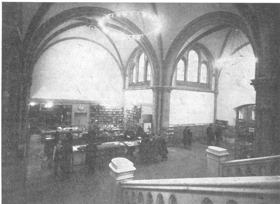
Az előcsarnok a kölcsönzõpulttal