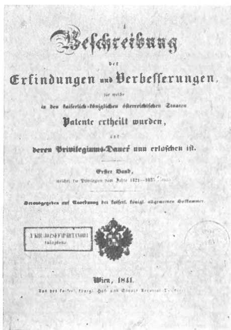
A Műegyetemi Könyvtár leltárába 1848. május 9-én bevezetett első könyv

Az első világháborúval megtört a Mű-egyetemi Könyvtár fejlődésének vonala, amely egészen a második világháborúig hullámvölgyeket és rövidebb ideig tartó fellendüléseket mutatott. Kivétel csupán a Magyar Tanácsköztársaság időszaka volt, amikor a Műegyetemi Könyvtár megnyitotta kapuit minden felnőtt ol-vasó számára, a használatot ingyenessé tette, és bevezette a vasárnapi szolgálato-t. A műegyetemi könyvtárosok haladó gondolkodására vall, hogy a Tanácsköz-társaság alatt kiadott kb. 700 nyomtat-ványt, röplapot, falragaszt a Horthy-korszakban is megőrizték és mint külön-gyűjteményt kezelték. 1934-ben a gazda-sági válság bajait az ellenforradalmi kul-tusz-kormányzat az egyetemek, főiskolák összevonásával kívánta orvosolni. A fel-