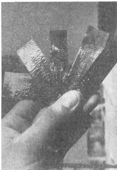
Az „arany cédulák”, amelyekért ötöst lehet kapni

— Milyen nemzetiségű az író?... (Ha van idő, a regény legizgalmasabb részét elmeséltetjük. A történelemhez kapcsolódó irodalomból általában az éppen tanult történelmi korszakkal kapcsolatos regényeket fogadjuk el. Ezekből a tanu-