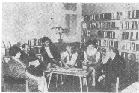
A Csongrád megyei Mezőgazdasági Gépjavitó Vállalat letéti könyvtára

Pest megye legnagyobb szabású könyvtári építkezése az elmúlt félévben az Albertirsai Községi Könyvtár új otthonának kialakítása volt. Az egykori ipar-testületi székházat 1 000 000 Ft költséggel építették át két nagytermes, gyermek- és felnőtt részlegből álló, szabadpolcos könyvtárrá. (Ld. a borítónk 3. ol-