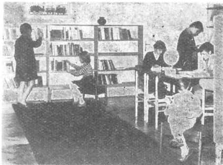
A debreceni Benedek Elek Városi Gyermekkönyvtár

dalán levő képeket.) Az ízlésesen berendezett könyvtár bútorait a Ceglédi Faipari Ktsz készítette. — A megye falusi könyvtárai közül önálló helyiséghez jutott a csemői , és a vecsesi könyvtár helyzete is lényegesen javult. A Szabad Föld által többször szóvá tett, igen rossz elhelyezésén úgy segített a községi tanács, hogy a művelődési házzal szembeni, volt üzlethelyiséget adta át a könyvtárnak, és új bútorzatot csináltatott számára.