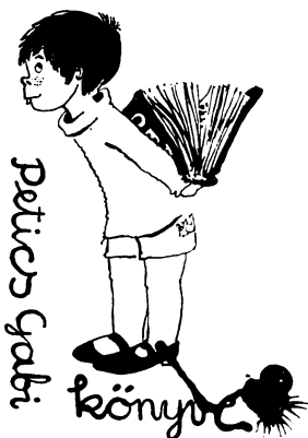
Mátyás I. Tamás ex librise

írások címmutatóját, hivatkozva a két sorozat megfelelő helyére. A hivatkozási számok a művet tartalmazó kötet sorszámára, a lelőhely lapszámára és a műre vonatkozó jegyzet lapszámára utalnak. A mutató fontos segédeszköz mind a gyermekkönyvtárban, mind a felnőttek könyvtárának tájékoztató szolgálatában, s ezért reméljük, hogy a 600 példányban kinyomtatott kis füzet eljut minden főhivatású könyvtárossal rendelkező könyvtárba.