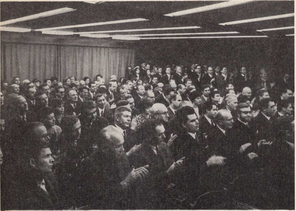
A Szombathelyi Megyei Könyvtár avatóünnepségének közönsége; az első sorokban a IV. nemzetközi könyvtárépítészeti konferencia résztvevői. Alsó képünkön: az új könyvtár homlokzati része