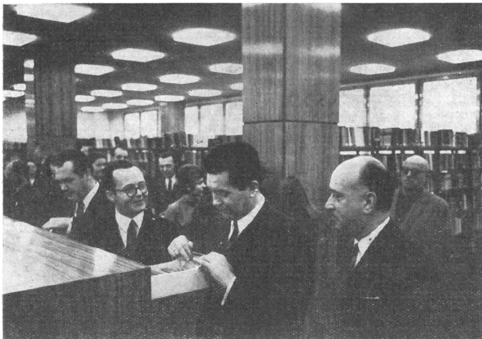
Gosztonyi János miniszterhelyettes és Gonda György megyei tanácselnök az új könyvtárban

Külön ki kell emelni, milyen mintaszerűen készítette elő az átköltözést a megyei könyvtár: a több mint 130 000 könyvtári egység átszállítása és rendezése miatt is csupán 16 napig szüneteltette a kölcsönzést, a gyermekek pedig csak 12 napig nem látogathatták a könyvtárt. Az olvasók a könyvtárhasználatot ismertető és a szabadpolcos térben való eligazodást megkönnyítő térképes kalauzt kaptak kézhez, ráadásul a megnyitás előtt megjelent a megyei könyvtár rangját emelő, munkájának magas színvonalát bizonyító, bármelyik nagykönyvtárunknak is becsületére váló, nagyon izléses és tartalmas évkönyv. Mindez azonban a könyvtár fenntartójának munkastílusát és magasfokú, nagyvonalú kulturális irányítótevékenységét is tükrözi: a megyei tanács gondoskodása következtében felemelt könyvtároslétszám lehetővé teszi, hogy az olvasók a korábbi 42 óra helyett heti 61 órában, a gyermekek pedig 24 óra helyett 51 óra időtartamban látogathassák a könyvtárt, ráadásul vasárnap délelőtt is. Bizonyosak vagyunk abban, hogy a Kaposvári Megyei Könyvtárhoz hason-