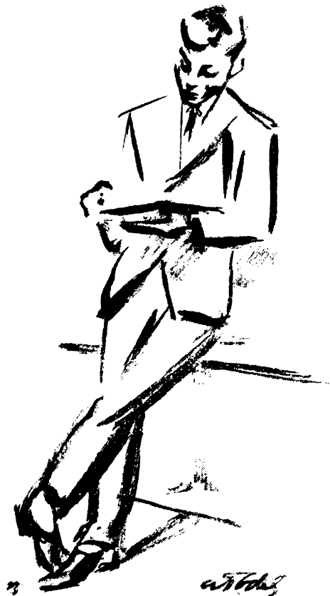
A. Tóth Sándor rajza

A helyi értelmiség? A körzeti orvos, a pedagógusok „beleszólhatnak” a könyvtár ügyeibe: a könyvtáros gyakran tanácsot kér tőlük, hogy milyen könyveket rendeljen. Egyébként a körzeti orvos volt az, aki „rászoktatta” a község vezető embereit, hogy esténként „beüljenek” a könyvtárba, nézelődni, beszélgetni. (Nem kis dolog!)