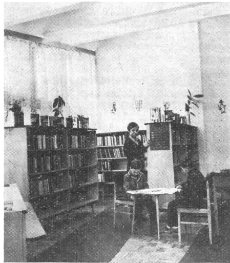
Részlet a könyvkiválasztó térből