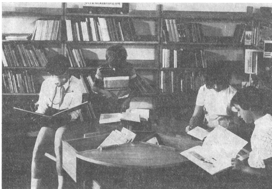
A gyerekrészleg

portosainak látogatása is eredményes volt. Azon kívül, hogy a gyermekek jól érezték magukat a mesedél előtt, megismerték a könyvtárat, s a következő vasárnapokon követelték szüleiktől az újbóli látogatást, amely nem egy esetben egy-egy felnőtt olvasó megnyerésével is járt.