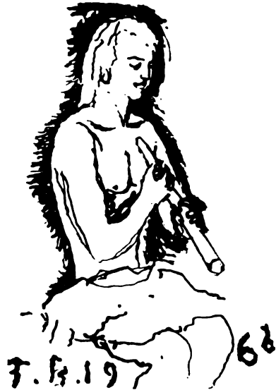
Ferenczy Béni „Fuvolázó” c. rajza

községi könyvtáros, Csokonyavisonta (Somogy m.)