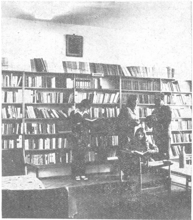
A szerencsi Bocskai István Gimnázium könyvtára