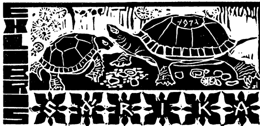
Szilágyi Imre ex librise