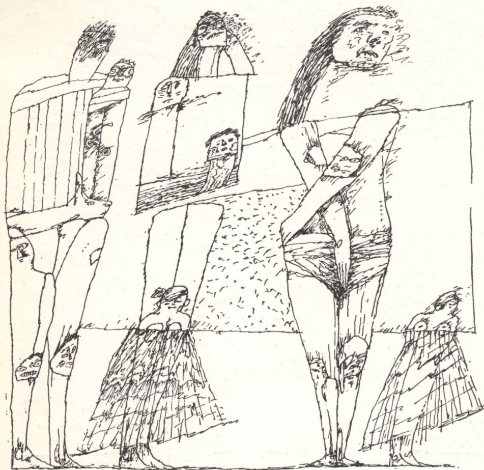
SZABADOS ÁRPÁD grafikáiból (Cikkünket lásd a 166. oldalon)