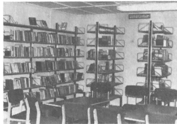
A körmendi fiókkönyvtár

helyi tanács 1,2 milliót fedezett, a többi a megyei tanács adta a berendezésre és a fűtés korszerűsítésére. – Körmend város kertvárosi részében , másfél ezer család olvasási igényeinek kielégítésére új, csaknem 50 m 2 alapterületű könyvtárat építettek a közelmúltban, a város ötödik fiókkönyvtáraként. A csaknem félmillióba került épület a Nyugat-magyarországi Fazagdasági Kombinátnál előre gyártott, cementkötésű forgácslapjából készült az intézmények, vállalatok szocialista brigádjainak segítségével, sok társadalmi munkával. A háromezer kötetes, 36-féle folyóiratot járató intézményt heti három alkalommal, összesen 14 órában látogathatják az olvasók.