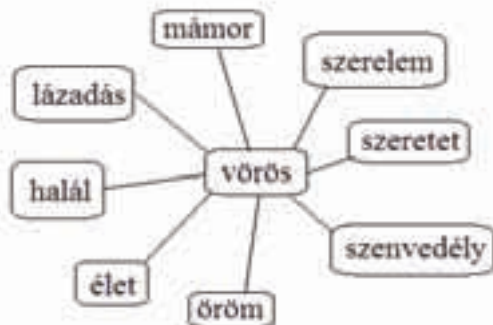
2. ábra: Áprily: Ajánlás . Pókhálóábra.

A rózsza–könyv színe „bordóvörös”. A vörös szín kiterjedt szimbolikájával többször találkoztunk már (pl. Áprily Lajos: Ajánlás című versében), most felidézünk néhány jelentést egy pókhálóábra segítségével: