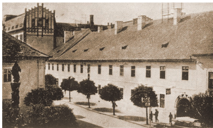
A kolozsvári Báthory-Apor szeminárium

„Sok próbálkozáson, részben hibás kezdeményezéssel s megfontolással kellett átvergődnünk – úgymond –, amíg eljutottunk ahhoz az egyedüli helyes fel fogáshoz, hogy az erdélyi magyar kisebbségi élet küzdelmeire rendelt intelligenciát itthon, Erdélyben, kell neveltetni. Ez a közvélemény vágta útját a magyar ifjak kifelé való tódulásának s növelte meg számukat a romániai, főképpen a kolozsvári egyetemen. A helyzetnek ez a helyes kialakulása azonban újabb problémát vetett fel számunkra: aggódalmasan kellett észrevennünk, hogy az egyetemre kerülő ifjaink nemzeti műveltsége megdöbbenően fogyatékos, perspektívája szűk, öntudata hiányos s a román egyetem nem az a hely, hol a magyar tudomány eredményeivel és szellemével kapcsolatba kerülnének. Mindezek megfontolása készítette az illetékes tényezőket egy olyan tanulmányi rendszer kialakítására, amelyen át közvetlen befolyással lehetünk egyetemi és főiskolai ifjúságunk magyar nemzeti tartalmának gyarapítására és öntudatának emelésére” – foglalta össze a Kolozsvári Magyar Egyetemi és Főiskolai Hallgatók Szemináriuma életbe hívásának okait György Lajos a Szeminárium életét koordináló Felügyelő Bizottság 1929. október 4-én tartott, második évet kezdő értekezletén. 10 Értésítése után két hónappal, 1928 novemberében már – a három felekezet jóváhagyása és felkérése nyomán 11 – a Kolozsvári Magyar Egyetemi és Főiskolai Hallgatók Szemináriumának tanulmányi igazgatói székében találjuk