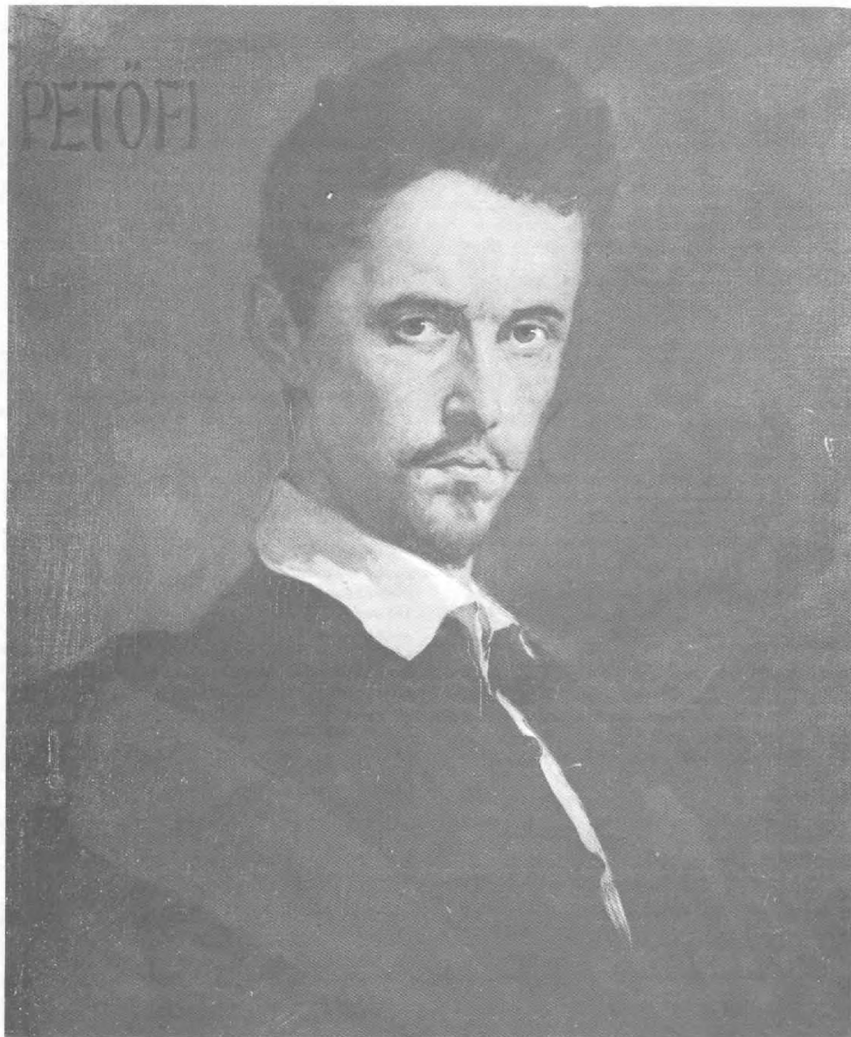
BENCZÜR, GYULA (1844-1920) - Petőfi Sándor arcképe, 1909 Olaj, vászon, 62,5 x 49 cm - Petőfi Irodalmi Múzeum, Budapest

SÃO PAULO, 1982. ÁPRILIS 25. BRAZILIAI MAGYAROK LAPJA