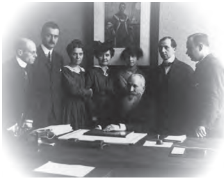
Batthyány Tivadar Beszámoló című kötetének belső borítóképe