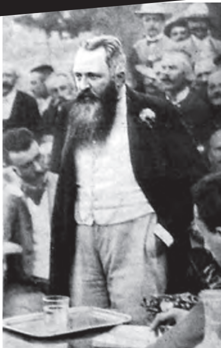
Batthyány gróf miniszteri, közéleti szerepben

is azt igazolták, hogy az ország területén élő nem magyarok egyáltalában nem lelkesednek a szabad Magyarország eszméjéért. A horvátok, szerbek, románok, rutének, szlovákok – és persze az itt élő németek – egyaránt elutasítják annak a gondolatát, hogy „nem magyarul beszélő magyarokká” váljanak, ahogy erről néhány valóságától elszakadt „próféta” még 1918-ban is álmodozott.