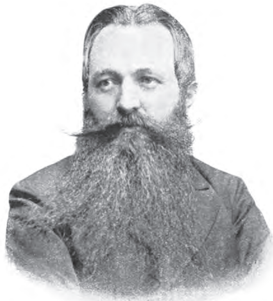
Batthyány Tivadar korabeli fotógrafikán

keket Ausztriában, mindenről tájékozódni és a magyar minisztereket otthon, Budapesten politikai és gazdasági eseményekről informálni, másrészt összekötést tartani fenn a külföldi diplomatákkal és az osztrák politika minden árnyalatával 13 . Igaza volt: a háború alatt e feladatok félreértésekkel teli kezelése számtalan váratlan nehézséget okozott: ez is hozzájárult a vereséghez. Grófunk tehát – addig lényegében betöltetlen – feladatot ismert föl, s nyilván őszinte elszántsággal igyekezett ebben az értelemben munkakörét kitágítani. Hamarosan azonban e tárca viselőjeként a Népjelölti Minisztérium főállításiának megtervezését is magára vállalta, s ha figyelembe vesszük azt a rövid időt, ami mindehhez rendelkezésre állt, láthatjuk, hogy hajlamos volt teljesítőképeségét alaposan túlbecsülni.