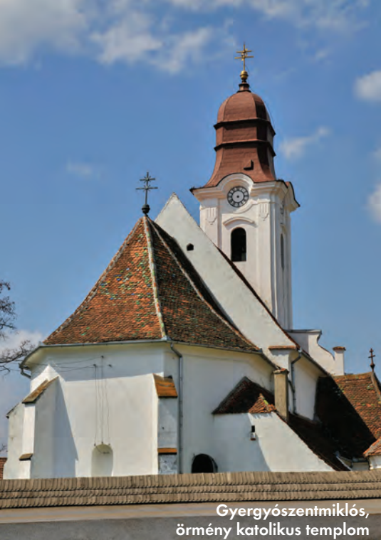
Gyergyószentmiklós, örmény katolikus templom