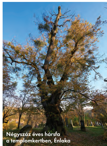
Négyszáz éves hársfa a templomkertben, Énlaka

A szerepüket megőrző, vagy hivatásukban átalakult zsinagógák, a hozzájuk kapcsolt egyedi temetők erős zsidó kultúráról tanúskodnak. Szamosújvár, Gyergyószentmiklós és a többi, kereskedelemben hajdanán izmos város öröme; a zenében, bádogos- és eltakarító munkában szinte mindenütt elől járó cigányság jelenléte; a vallásos nézeteik miatt elűzött, s itt menedéket találó habánok és unitárius lengyelek befogadása mind azt igazolja, hogy egy élni és fejlődni akaró makroközösségben, egy élni akaró kis országban mindenkinek helye van, aki jó szándékkal bír. Erdély bizonyítéka annak, hogy a másság – ha nyújtani akar és a föld észszerű törvényeit megtartja – nem jelent hátrányt, hanem inkább gazdagságot és életképebb, több síkon zajló kiteljesedést.