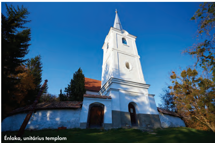
Énlaka, unitárius templom