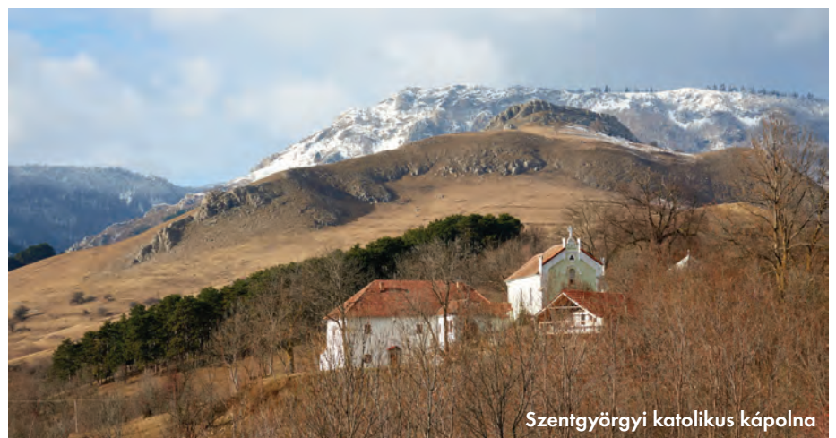
Szentgyörgyi katolikus kápolna

M indenekelőtt szeretném elmondani azt, hogy az örökös pusztítások, felperzselések, konfliktusok, mostoha viszonyok ellenére az itteni égtájak alatt egy olyan érdekes, színes és színvonalas kultúra alakult ki, amely azt jelzi, hogy szászok és cigányok, románok és örmények, szlávok és székelyek, zsidók és magyarok képesek voltak megtalálni az utat az egyetemes európai műveltséghez úgy, hogy közben saját karakterüket, szellemi önállóságukat is megőrizték.