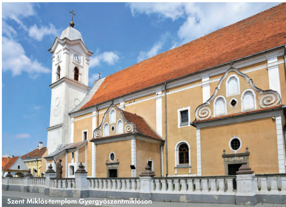
Szent Miklós-templom Gyergyószentmiklóson