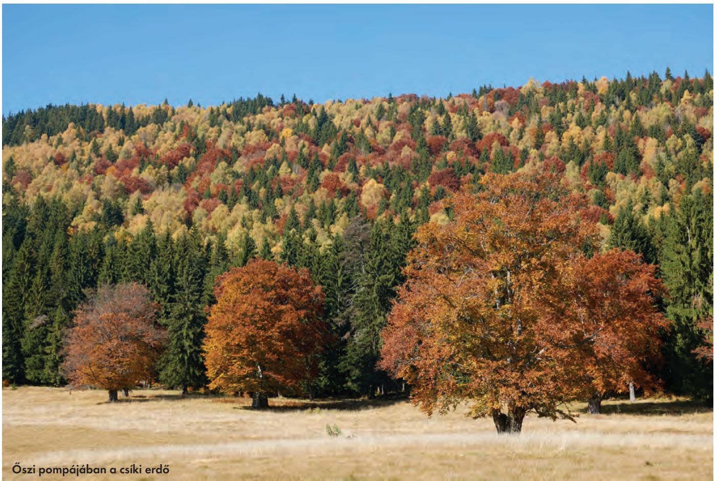
Őszi pompájában a csiki erdő