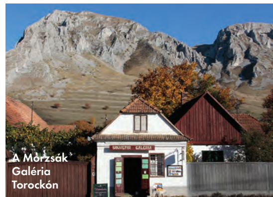
A Morzsák Galéria Torockón

– Maradjunk még picit Torockónál! Üldögélünk ebben a csodálatos kertben, és ha körülnézünk, a táj sok mindenről árulkodik. Mennyire fontos a helyszín, amikor elkészül egy fotográfia, mi az, ami inspirál téged, függetlenül attól, hogy éppen Erdélyben vagy Budapesten tevékenykedsz?